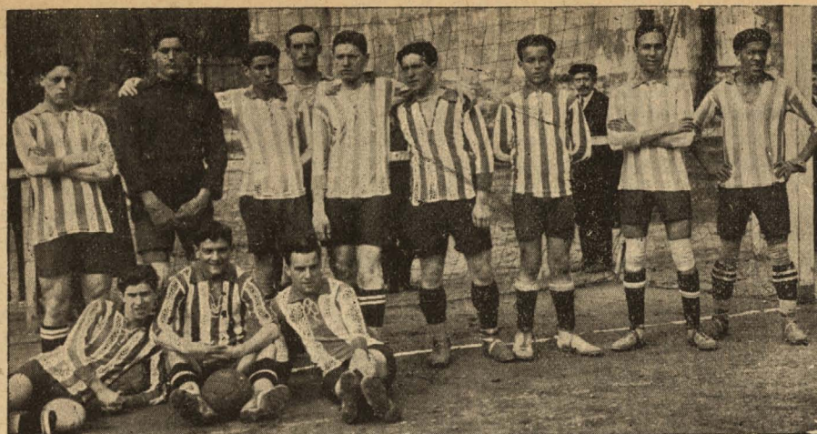
EQUIPO DEL «INTERNACIONAL» DE BARCELONA

ciosas que ponen en gran peligro la meta atlética.