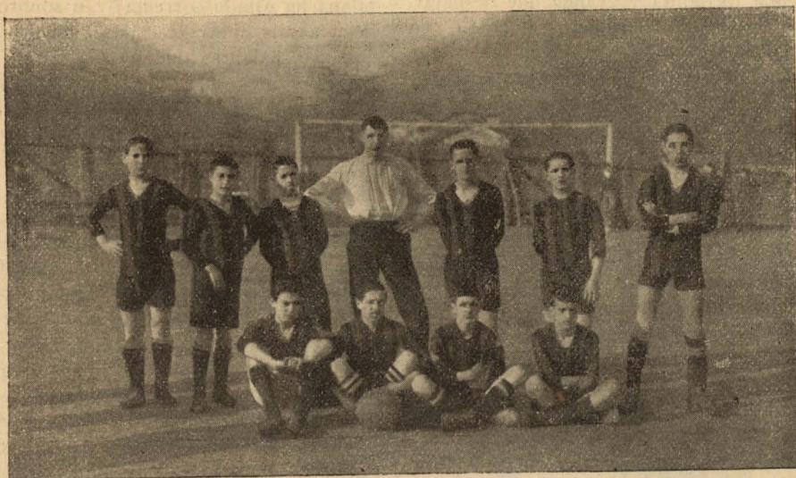
EQUIPO INFANTIL «DEPORTIVO CLUB» DE EIBAR QUE ESTÁ OBTENIENDO GRANDES ÉXITOS