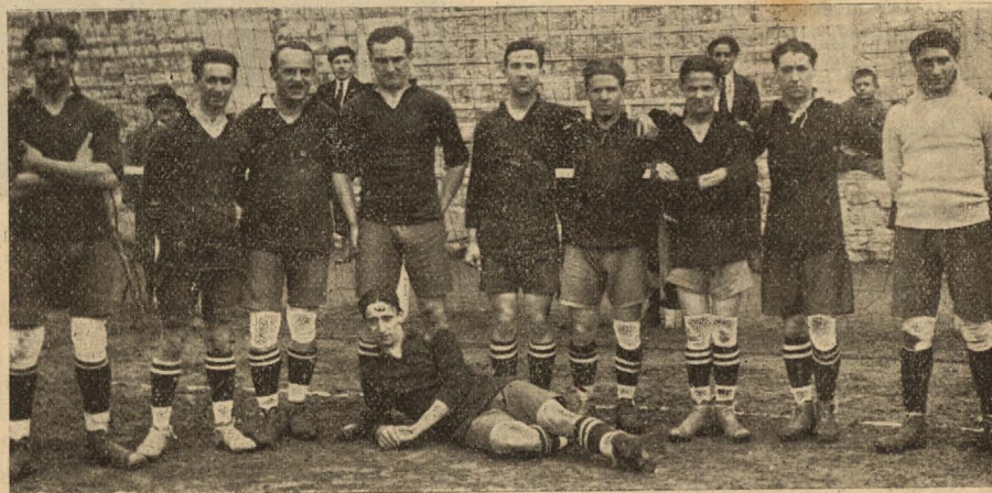
EQUIPO COMPLETO DE LA «REAL SOCIEDAD» QUE ACTUÓ EN EL PARTIDO DE DESPEDIDA DE SIDLER