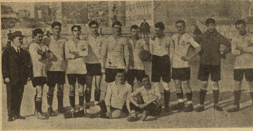
Equipo del «Real Unión» de Irún, vencedor del «Madrid F. C.» en la Corte