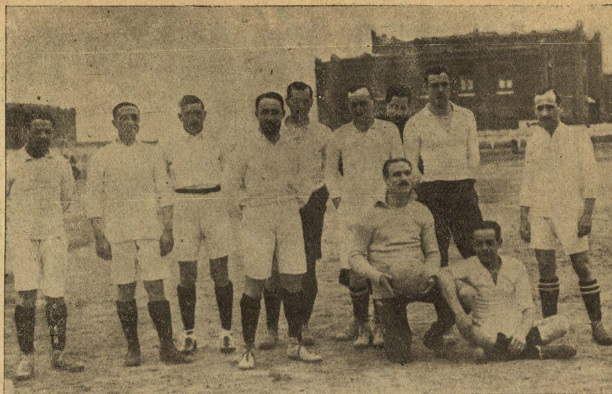
En el Campo del Madrid F. C.

El segundo fué una decepción; aquello ni fué ni será juego de futbol.