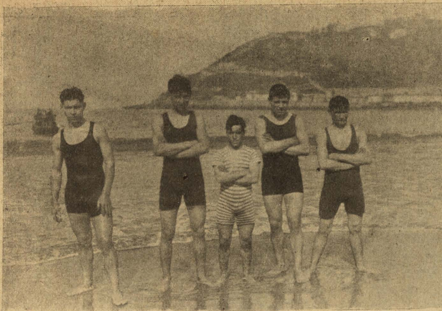
Los participantes de la prueba de Natación organizada por el «Racing Club»