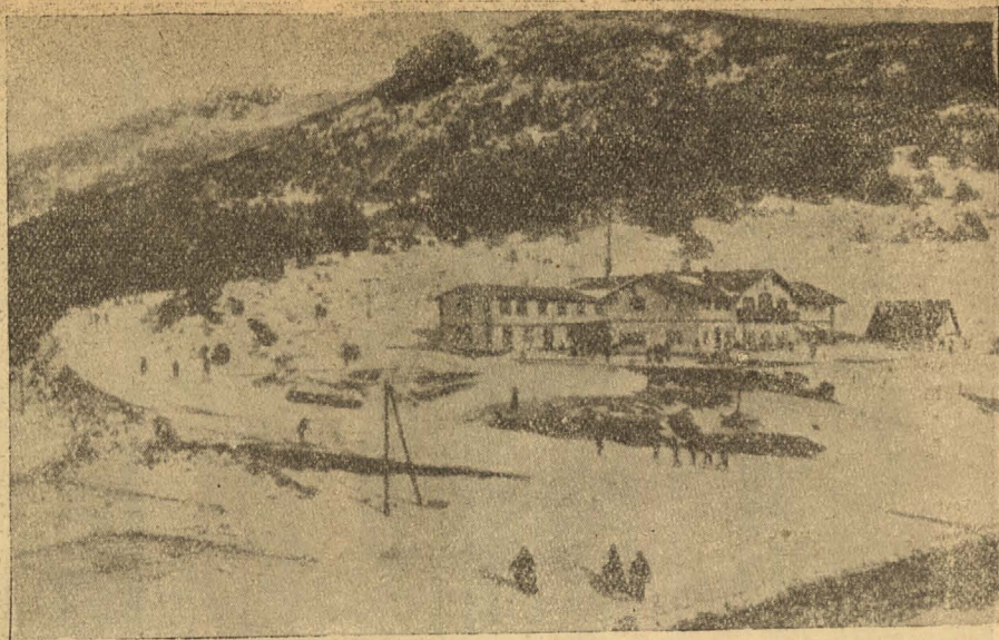
Vista del Chalet del Club Alpino Español

Otra parte esencial del ski es la atadura o fijación, cuestión que ha dado lugar a muchas discusiones entre los aficionados. En términos generales una buena atadura debe llevar bien fijo el pie, impidiendo todo movimiento a los lados pero permitiendo arrodillarse sobre el ski. Entre los tipos mas conocidos de ataduras mencionaremos las Elleuseu, Huilfted, Balata, Banclair, Lilienfeld. Con esto y recomendar al skieur el tener siempre los skis en prensa para evitar se desformen,