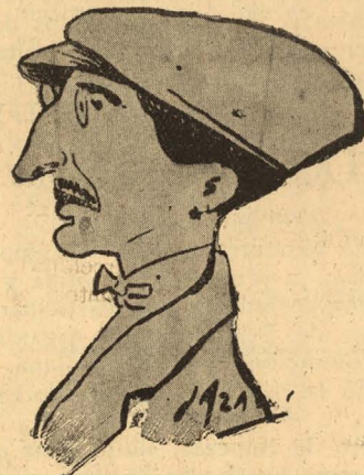
RICARDO HURTADO del Colegio de Árbitros