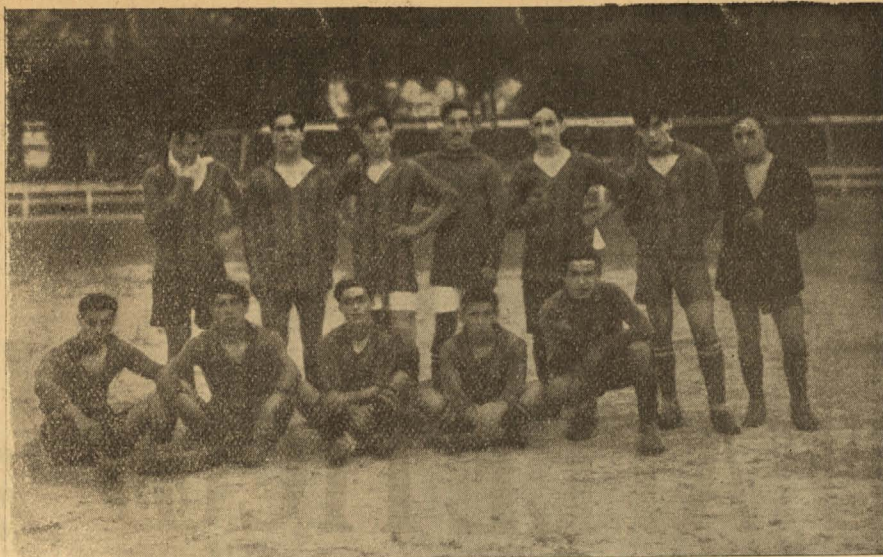
Equipo del Español F. C.