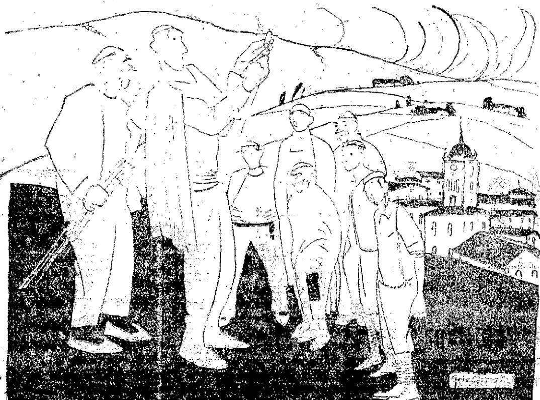
—¿Pa político madrileño ya valés, pues! —¿Por qué? —Pregos artipitiales como ellos ya hases.

LA REMINGTON Portátil, además de llenar las necesidades de los viajeros, es igualmente útil a todos los que no tienen suficiente correspondencia para poseer un modelo de oficina. Esta máquina, cuando no está en uso, puede ser guardada fácilmente en la gaveta del escritorio o en cualquier otro lugar apropiado. Los viajeros de comercio, médicos, curas, escritores, dueños de tiendas, agricultores, estudiantes, la consideran de una gran ayuda en sus respectivas labores.