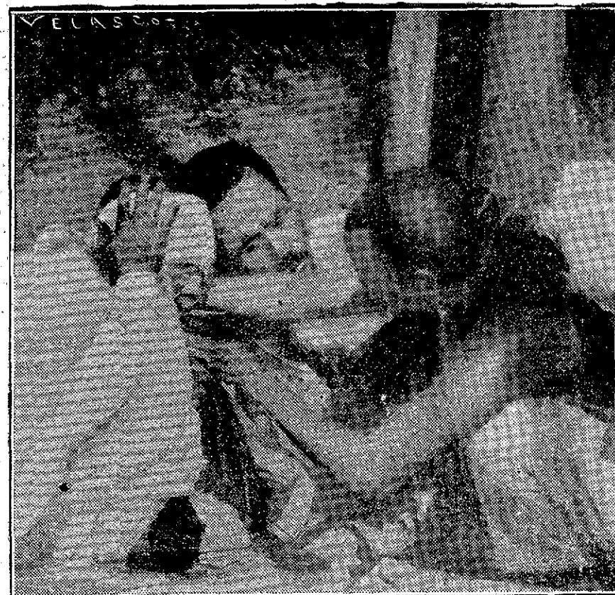
MIENTRAS SE ESPERA LA LLEGADA DE LA AMBULANCIA, EL HERIDO QUE SE DESANGRA BEBE ANSIOSO EL AGUA QUE LE OFRECE OTRO SOLDADO

Petró Maravigna, ha iniciado un movimiento en dirección a la región de Addis Abeba a unos ochenta kilómetros al sur de Tokule, región descrita en los mapas como inexplorada.—(United Press.)