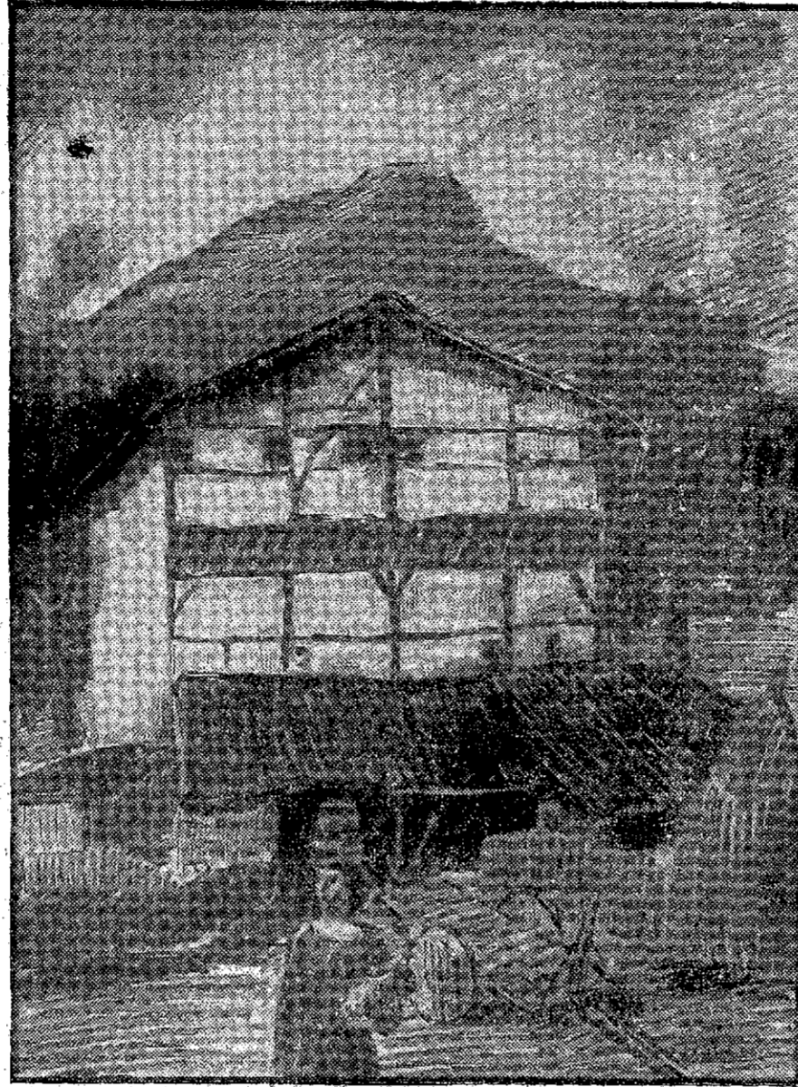
ZUMARRAGA. -- Casa nativa de Miguel López de Legazpi

A pesar de que la flota inglesa "ocupando dos leguas de mar, parecía una selva maravillosa flotante de árboles, antenas y jarcas".