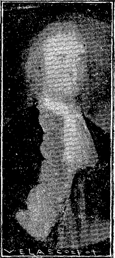
D. BLAS DE LEZO: retrato original, propiedad de la Marquesa de Cartago.

No fué el pueblo de Lezo el que dió el nombre a la familia, sino al revés. "Lezo antes que Lezo" podían decir los Lezo en su blasón, imitando el "Zarauz" de la famosa inscripción de la villa costera.