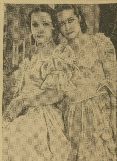
Son muchas las artistas de "cine" que tiene su "doble". Dolores del Río, por ejemplo. Aquí la vemos junto al suyo. Y en verdad que hay algún parecido. A Dolores del Río, la notable "estrella" mejicana, la vemos a la izquierda