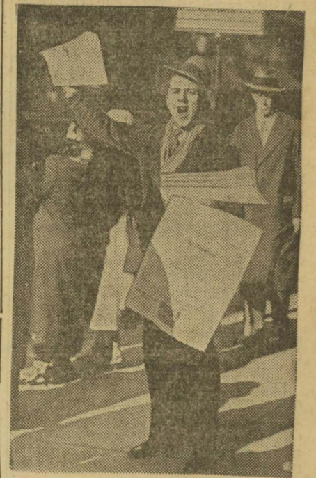
Esta fotografía ha sido tomada en Roma. Trátase de un vendedor de periódicos que anuncia la publicación de números extraordinarios con las últimas noticias de la guerra italo-etíope

Puede decirse que después de su muerte la Conferencia del Desarme está llamada al fracaso.