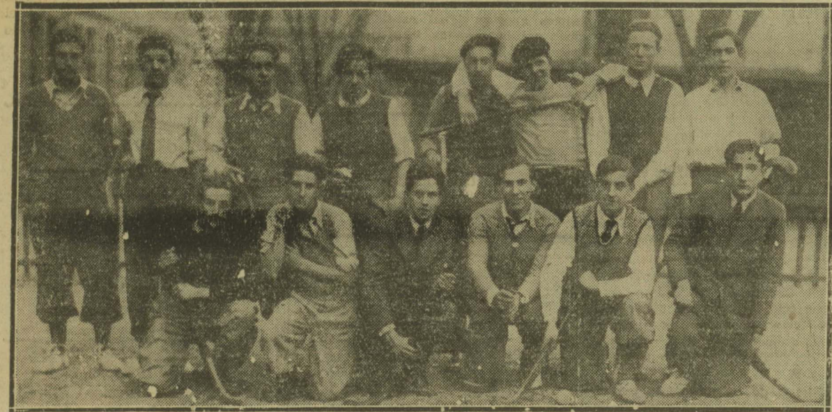
Equipo de hockey del Colegio de Santa María que jugaron un partido entre alumnos los días de Carnaval.