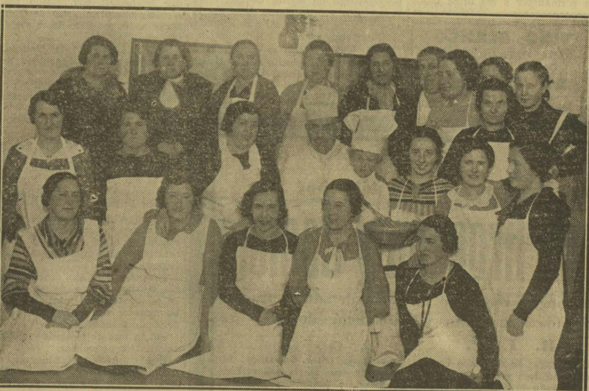
Grupo de emakumes asistentes, en el domicilio de Emakume Abertzale Batza de Donostia, a las clases de cocina organizadas por el citado grupo femenino patriótico

NOTA. — La conferencia será pública y gratuita. Se celebrará en los salones de la Casa de Francia, Avenida de Francia.