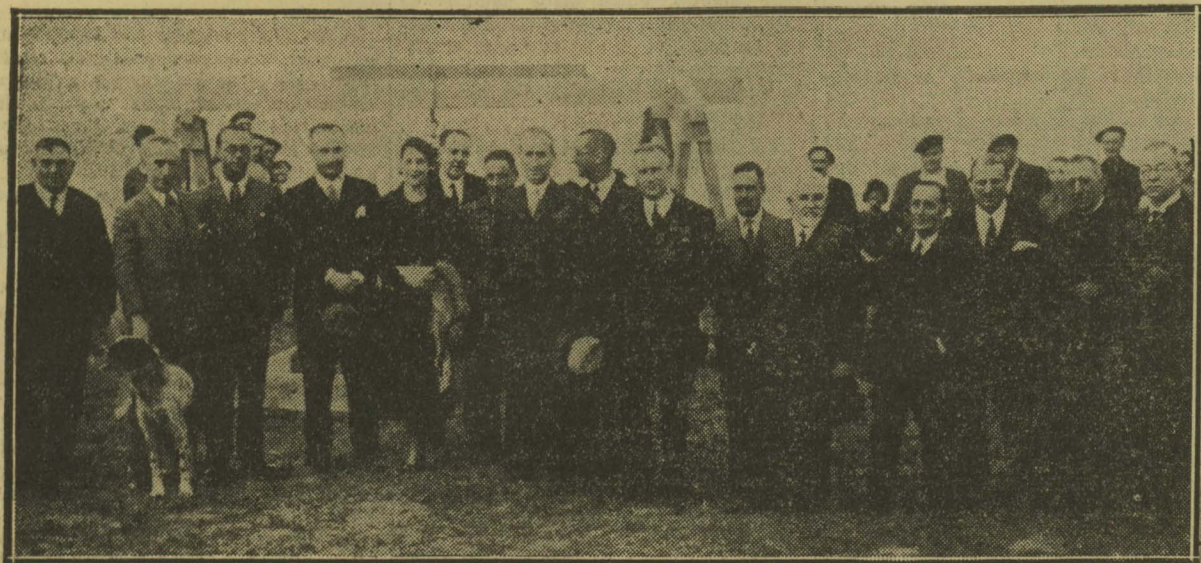
Asistentes al acto de la colocación de la primera piedra del chalet del campo de tiro que se edificará en el Monte Igueldo

Ayer se colocó la primera piedra del chalet del campo de tiro, con asistencia de las autoridades