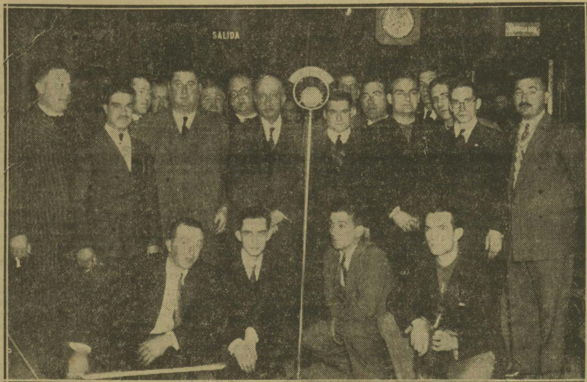
Elementos de la agrupación artística Irnngo Atsegiña, que actuaron ayer brillantemente en la emisión euskérica ante el micrófono de Unión Radio