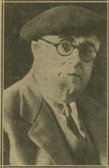
El Presidente de la Federación Española de Pelota, don Andrés Peña, es un entusiasta del juego de rebote

ha perdido la afición al "rebote"? —Eche usted la culpa, por encima de todo, a la industrialización del juego de la pelota.