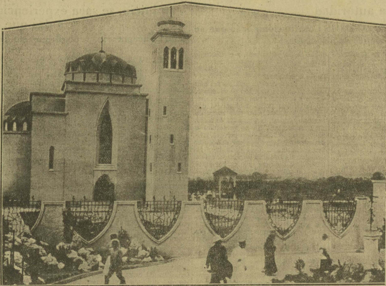
He aquí una iglesia de Shanghai, hoy de tanta actualidad por el conflicto entre China y Japón. El Vicariato Apostólico de Nankin, en cuyo territorio hallanse las dos ciudades, de Shanghai y Nankin, tiene unos 200.151 católicos, con 188 sacerdotes, 85 de ellos indígenas, 94 Hermanos coadjutores (chinos, 22) y 543 Misioneras de siete Congregaciones diferentes, 233 de las cuales son también indígenas