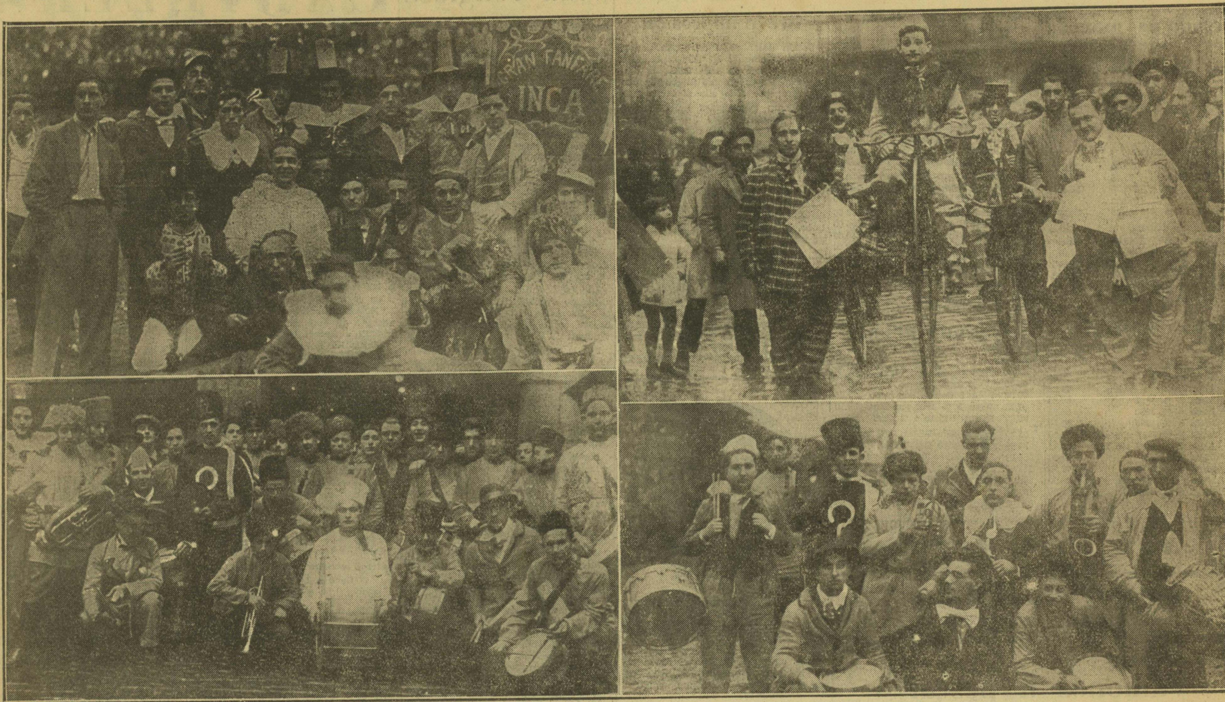
Desbordante de humorismo, los simpáticos jóvenes tolosarras celebran del modo que muestra el grabado, los días de consagración pagana al dios Momo