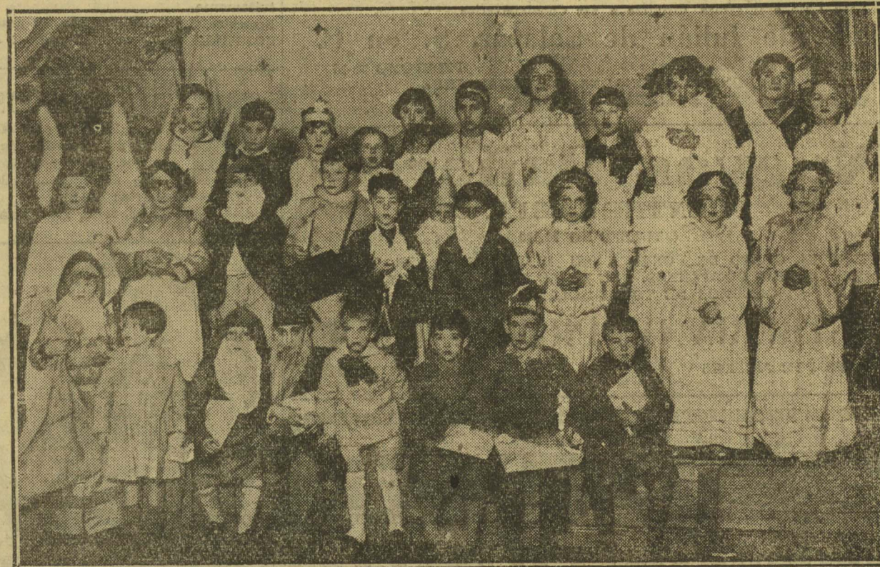
El Colegio Alemán, anticipando un poco la Navidad, organizó ayer una fiesta, para repartir juguetes a sus alumnos, en el Ateneo Guipuzcoano. La fiesta resultó muy animada y los pequeños temoncitos lo pasaron muy agradablemente. Y sin todos muy guapos, como p puede verse