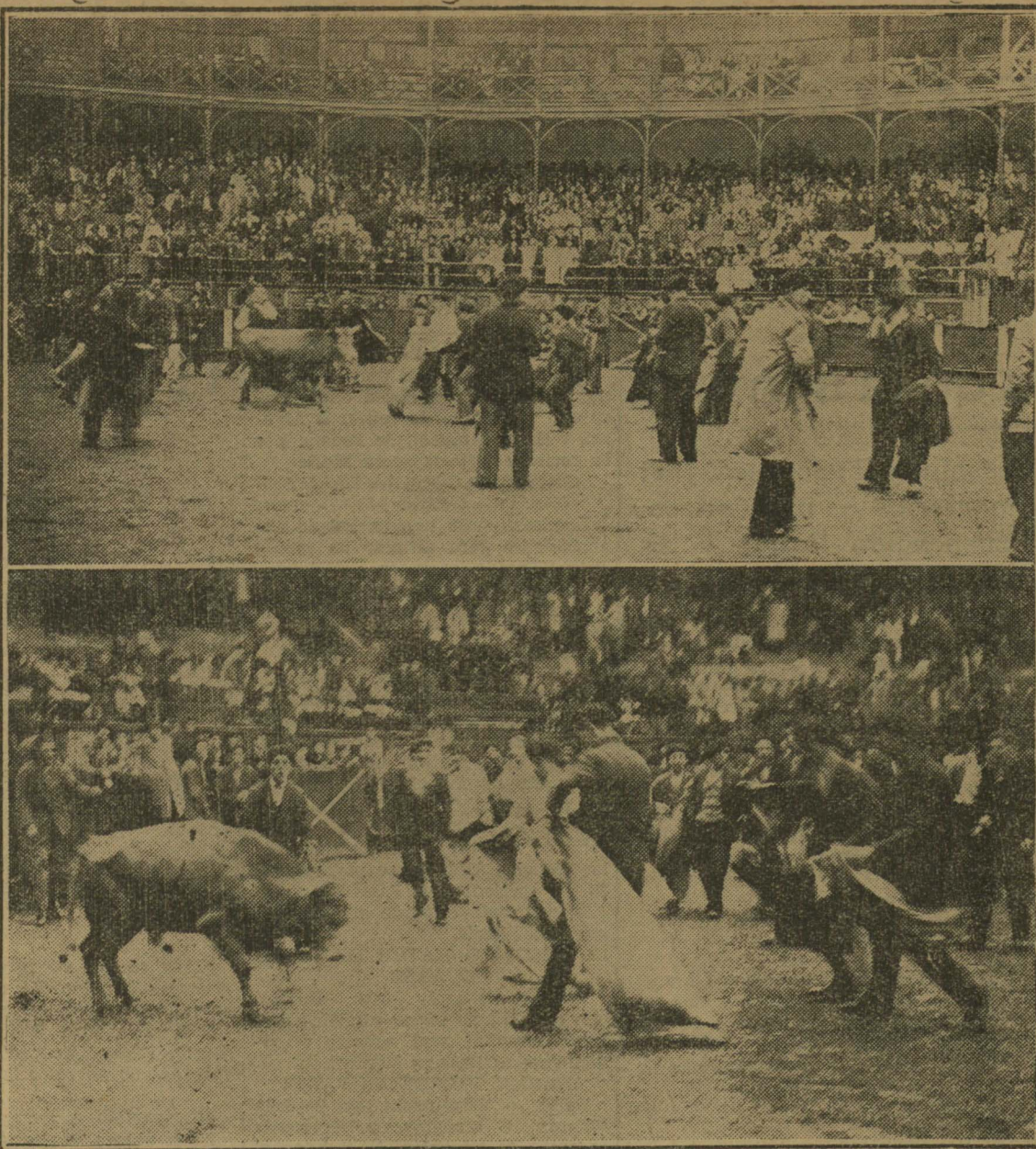
Aspecto que ofrecía la Plaza como prelude de las famosas fiestas de Carnaval.

MIRACRUZ, 14. — RELOJERIA LEONCIO GONZALEZ