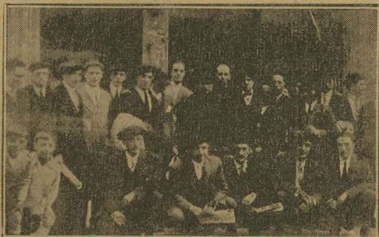
HERNANI. - Componentes del Coro de la parroquia en su excursión a Lequeitio.

ficio del Nuevo Seminario. En él quedaban ya de únicos dueños los jóvenes seminaristas y sus profesores que seguramente honrarán con sus probadas dotes de virtud y de cultura este grandioso centro de estudios levantado por el celo de ejemplares preladados y por la piedad de sus diocesanos, los católicos vascos, que constituye un nuevo motivo de orgullo de esta raza magnífica y gloriosa.