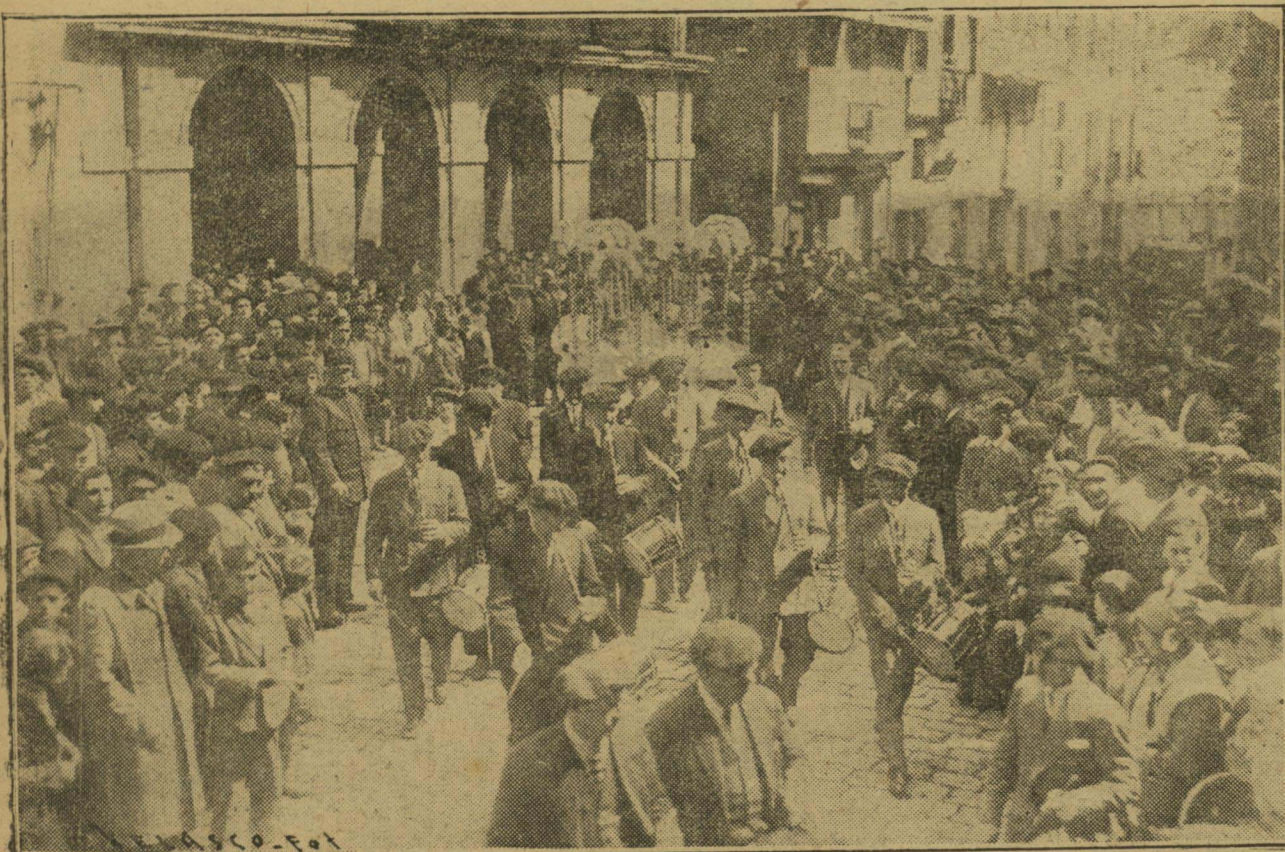
LAS AUTORIDADES DE RENTERIA CON LAS REPRESENTACIONES OFICIALES, DIRIGIENDOSE AL TEMPLO PARROQUIAL ACOMPAÑADOS DE TXISTULARIS Y DANTZARIS