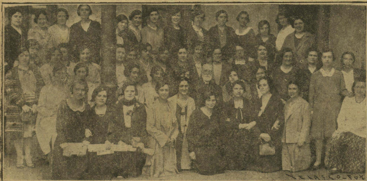
EN LAS ESCUELAS DE AMARA SE REUNIERON EL PASADO DOMINGO CON MOTIVO DEL REPARTO DE PREMIOS LAS ANTIGUAS ALUMNAS DE LA NORMAL DE MAESTRAS QUE ASISTEN A LAS CLASES "CONCEPCION ARENAL".