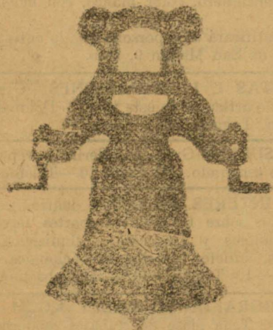
Campanas de yugo de hierro de una sola pieza

Calle de Francia y Portal de Urbina VITORIA (Alava)