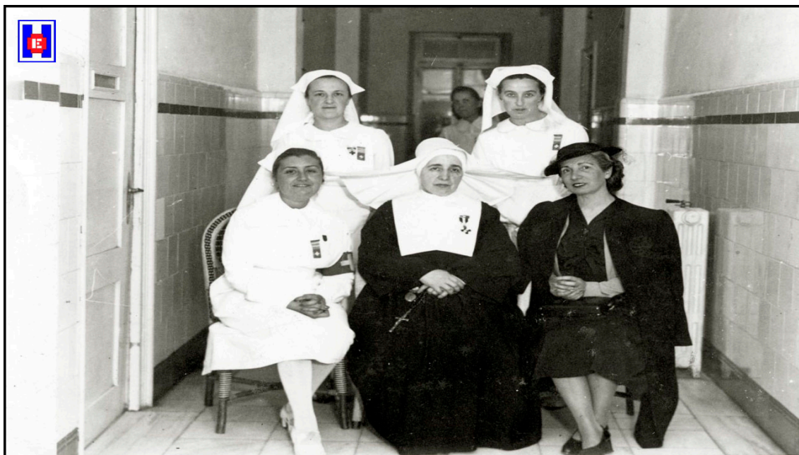
FOTO 10 Enfermeras e Hija de la Caridad con una señora de la Junta del Patronato. Hospital Militar Generalísimo Franco en Aldaconea. 1937

Al Jefe del Estado le fue enviado un telegrama el día de la inauguración, firmado por el Jefe de Sanidad de Gipuzkoa (3).