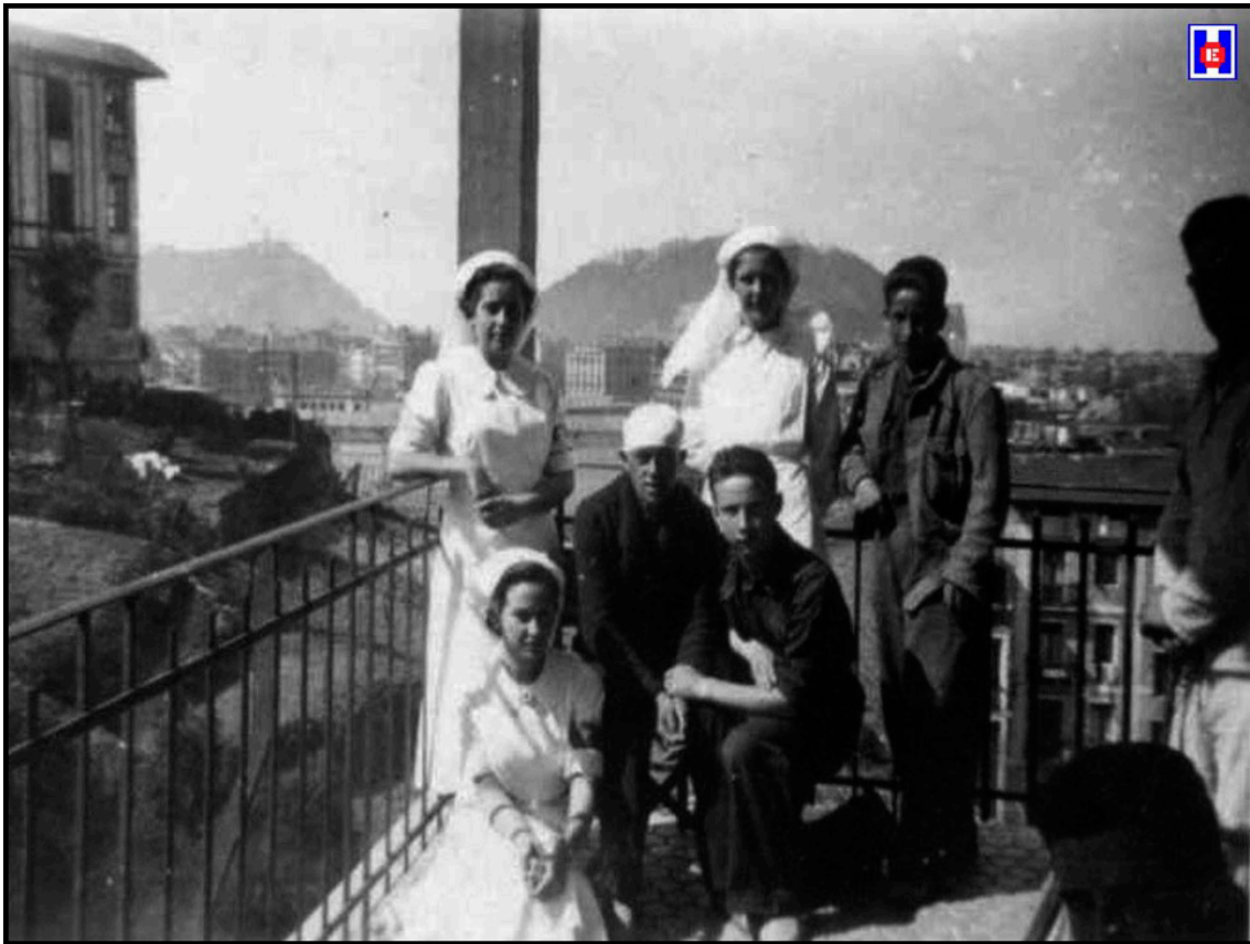
FOTO 5 Enfermeras con soldados heridos. Hospital Militar Generalísimo Franco en Aldaonea. 1937

la mañana de hoy. La idea del nombre nació del amor que los españoles le profesamos. El permiso para utilizarlo no es más que la consecuencia de la confianza de los hijos con el padre del españolismo. ¡Viva España! El Jefe de Sanidad” (2).