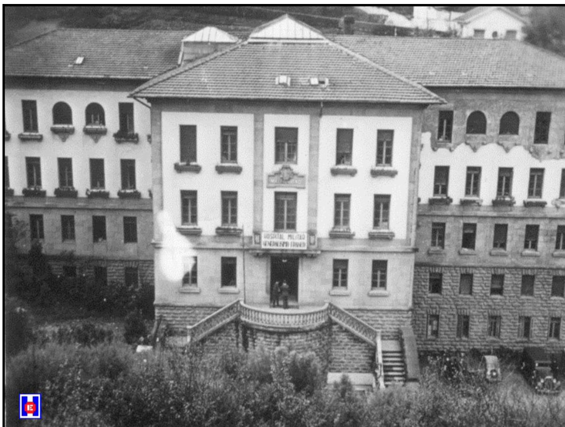
FOTO 1 Hospital Militar Generalísimo Franco en Aldaconea. Antigua Maternidad de San Sebastián. 1937