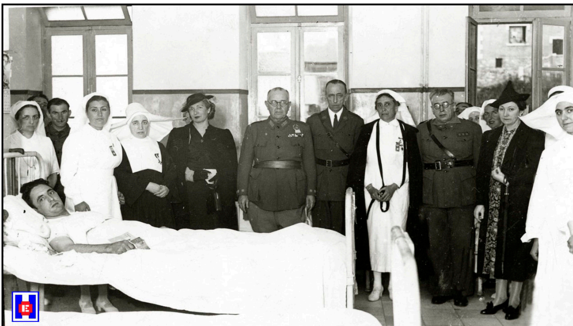
FOTO 4 Militares, Hijas de la Caridad y enfermeras con un soldado herido. Hospital Militar Generalísimo Franco en Aldaconea. 1937

A las once de la mañana del domingo se verificó la inauguración del nuevo Hospital del Generalísimo Franco, instalado en Aldaconea (2).