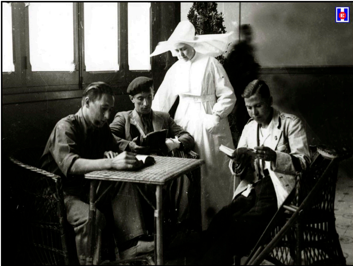
FOTO 6 Hija de la Caridad con los soldados convalecientes. Hospital Militar Generalísimo Franco en Aldaconeá. 1937

En la capilla, donde se dijo una Misa, la imagen de la Milagrosa destacaba entre rosas y claveles, como promesa de salud para los heridos y triunfo victorioso para los que luchan por Dios y por España.