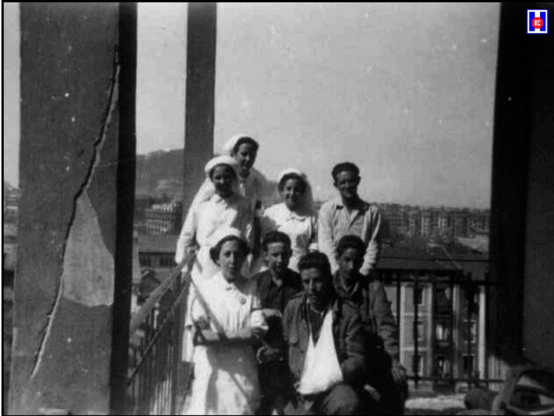
FOTO 9 Enfermeras con soldados heridos. Hospital Militar Generalísimo Franco en Aldaconea. 1937