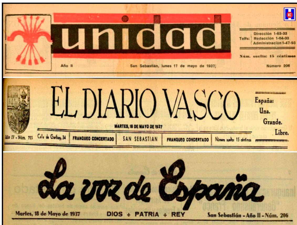
FOTO 3 Cabeceras de los periódicos del artículo. Unidad día 17, El Diario Vasco y La Voz de España día 18 de mayo de 1937

El acto resultó brillantísimo, mereciendo la instalación del Hospital del Generalísimo Franco, unánimes elogios a los que unimos el nuestro sincero y efusivo (1).