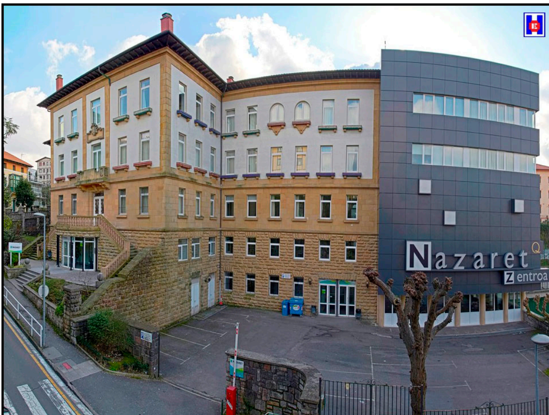
FOTO 12 Edificado en la cuesta de Aldaconea de San Sebastián. Hoy en día es Nazaret Fundazioa (septiembre de 1996), anteriormente Escuela Hogar Virgen del Coro (Obra social de la Caja de Ahorros Municipal de San Sebastián. Finales de 1953). 1 de diciembre de 1932 Maternidad de San Sebastián