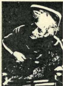
El comandante Cousteau, sellando de una inmersión

Con la proyección de "Viaje al fin del mundo", de J. Y. Cousteau, comienza hoy en el salón de Actos de la CAP el VI Ciclo Internacional de Cine Submarino de San Sebastián. A las doce del mediodía se realizará la inauguración oficial del Certamen, por el presidente de la Federación de Actividades Subacuáticas. A continuación se proyectará esta película, que podrá verse de nuevo a las siete y media de la tarde.