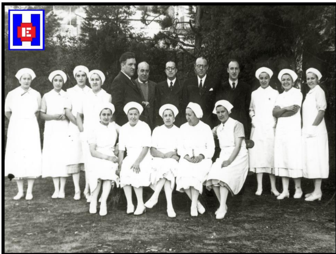
FOTO 7 Matronas, enfermeras, médicos y practicantes de la Maternidad de San Sebastián. 1933