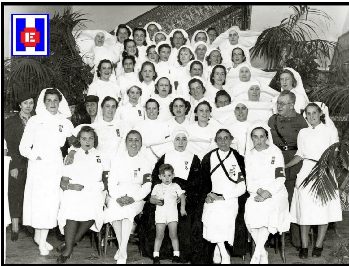
FOTO 4 Personal sanitario en la escalera de la Maternidad de San Sebastián, 1933