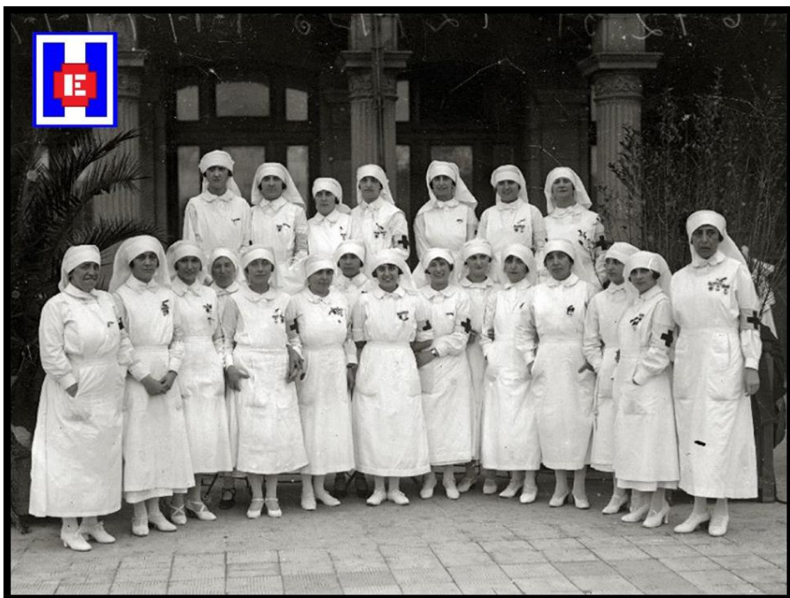
FOTO 9 Hospital Gran Casino. Damas Enfermeras de la Cruz Roja de San Sebastián. 1924

Me comprometo a servir con lealtad y obediencia a aquéllos bajo cuya dirección estoy colocada. Que nunca en el cumplimiento de mis funciones me falten la paciencia, la bondad y la comprensión (6).