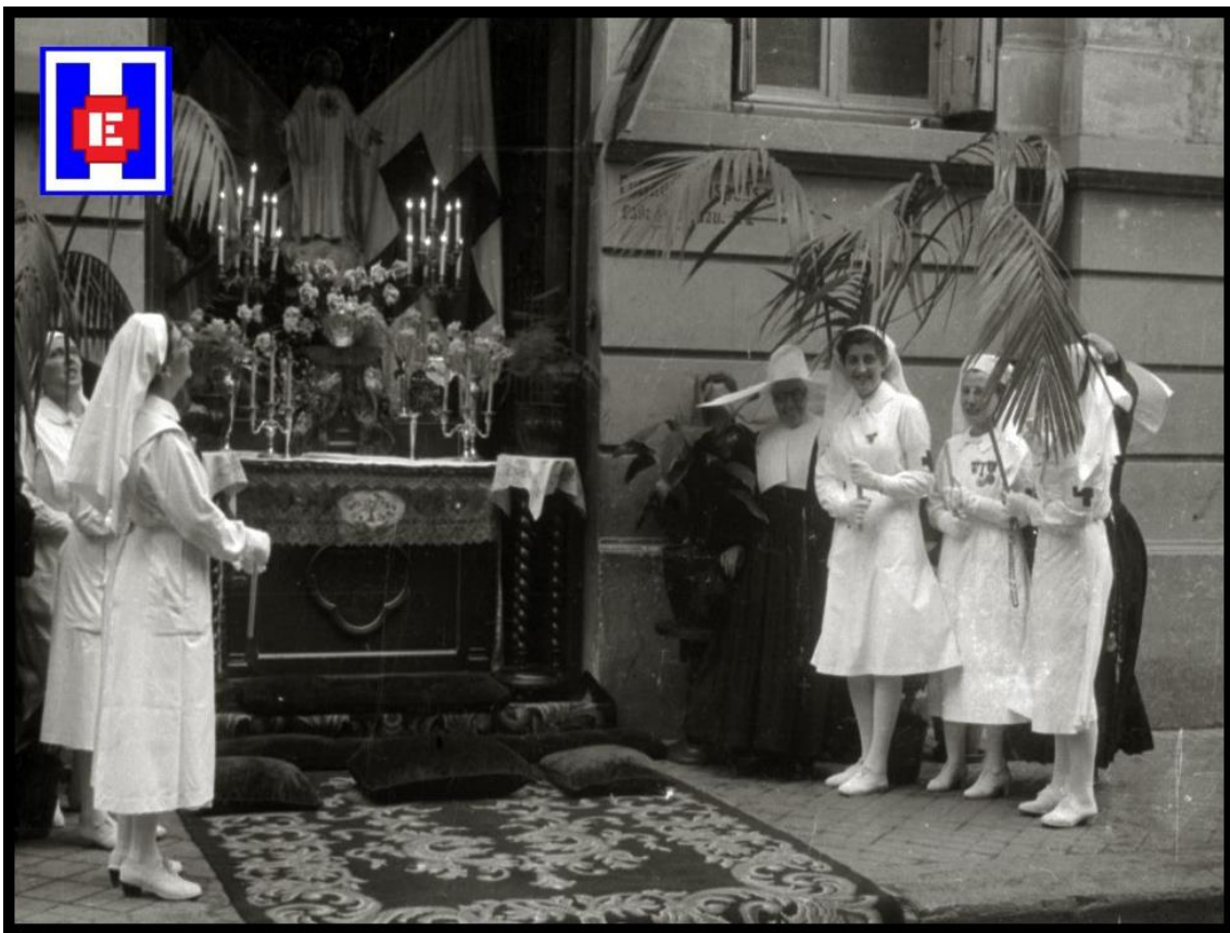
FOTO 6 Celebración de un acto religioso en el exterior del Hospital de la Cruz Roja de San Sebastián. Hijas de la Caridad y Damas Enfermeras. 1944.

También le fue entregado a la obsequiada un espléndido ramo de flores.