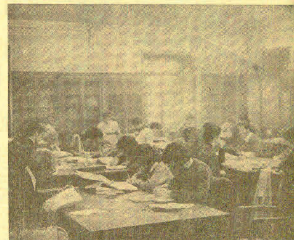
Mucho ambiente en la única sala de la biblioteca de la Diputación.

—Se van transmitiendo las noticias unos a otros. Hoy, todos los que realizan estudios de lingüística que tengan relación con el euskera, ya saben que tienen que acudir a San Sebastián para encontrar las mayores fuentes escritas.