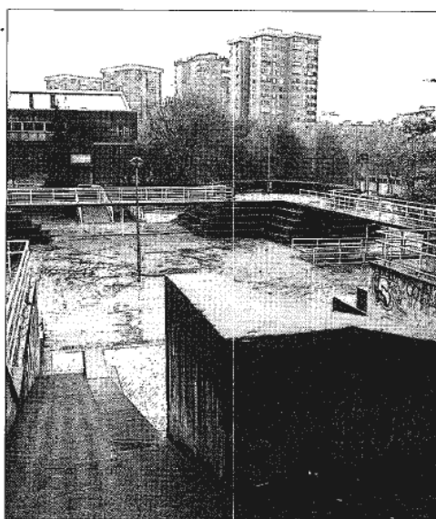
El parque de Bidebieta será rehabilitado después de una encuesta.

Además de las encuestas, el departamento se plantea dos importantes retos. Uno de ellos consiste en la firma de un pacto de civismo entre las instituciones y las entidades sociales y vecinales. Este documento girará en torno a la limpieza de la ciudad y supondrá adquirir «un compromiso entre todos los donostiarres para evitar la conta-