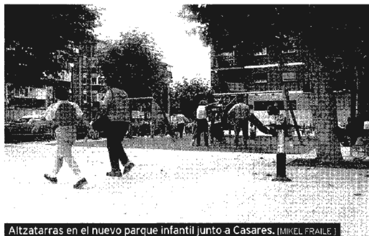
Altzatarra en el nuevo parque infantil junto a Casares.