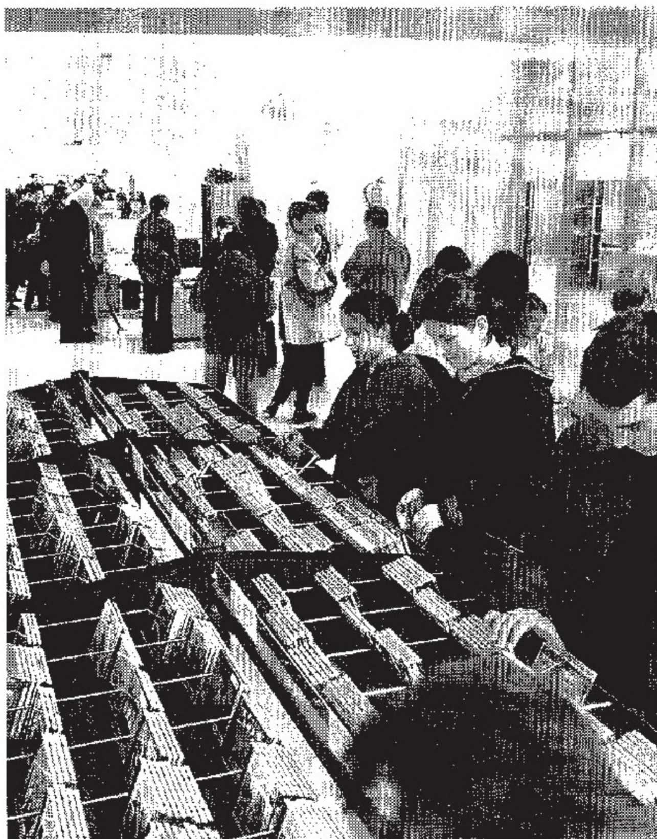
La biblioteca de la casa de cultura de Amara, que incluye fondos de discos y vídeos. IAYGELSI

La memoria del Patronato reconoce que no es posible ofrecer datos sobre la actividad concreta