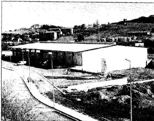
Exterior de Merkabugati, situado en Zubieta, junto a la N-1.