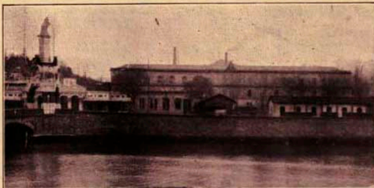
Vista de la Fábrica de Tabacos, tomada desde el puente María Cristina

El primer edificio que se alza majestuosamente frente a la estación del Norte y que se divisa al llegar a San Sebastián, es la fábrica modelo de tabacos.