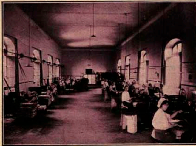
Taller mecánico de elaboración de cigarros.

tas las empaquetadoras y cuatro las desvenadoras, que son las que separan a mano la hoja de la rama, operación que efectúan las más ancianas.