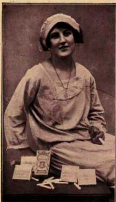
Una linda cigarrera

El primer edificio que se alza majestuosamente frente a la estación del Norte y que se divisa al llegar a San Sebastián, es la fábrica modelo de tabacos.