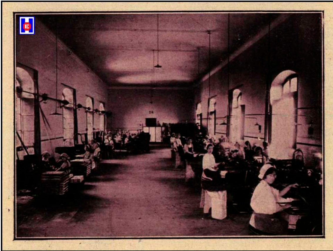
Foto 2 Taller mecánico de elaboración de cigarros