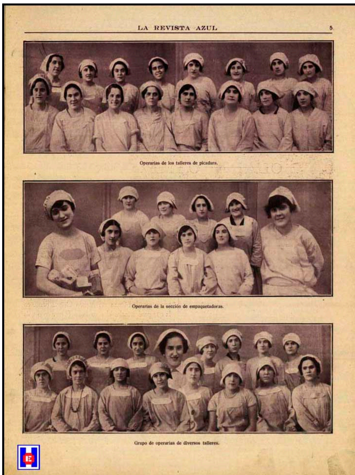
Foto 5 Operarias de los talleres de picadura. Operarias de la sección de empaquetadoras. Grupo de operarias de diversos talleres

Sofía Blasco , directora de la Revista Azul.