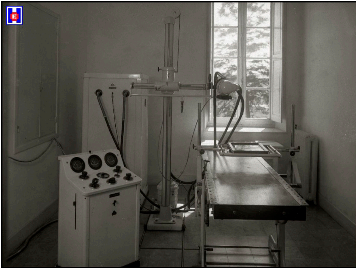
Foto 25 Sala de Rayos X de la Clínica Martín Santos.