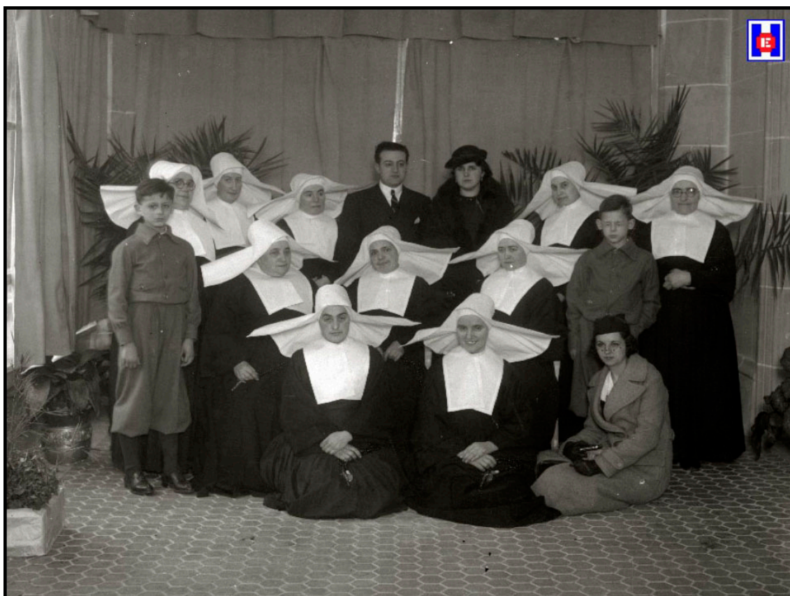
Foto 5 El día de la inauguración con su mujer y sus hijos Luis y Leandro y con las Hijas de la Caridad que trabajaban en el Sanatorio Quirúrgico Dr. Martín Santos. 1936

En el tercer piso se han instalado un oratorio y las habitaciones para todo el servicio.