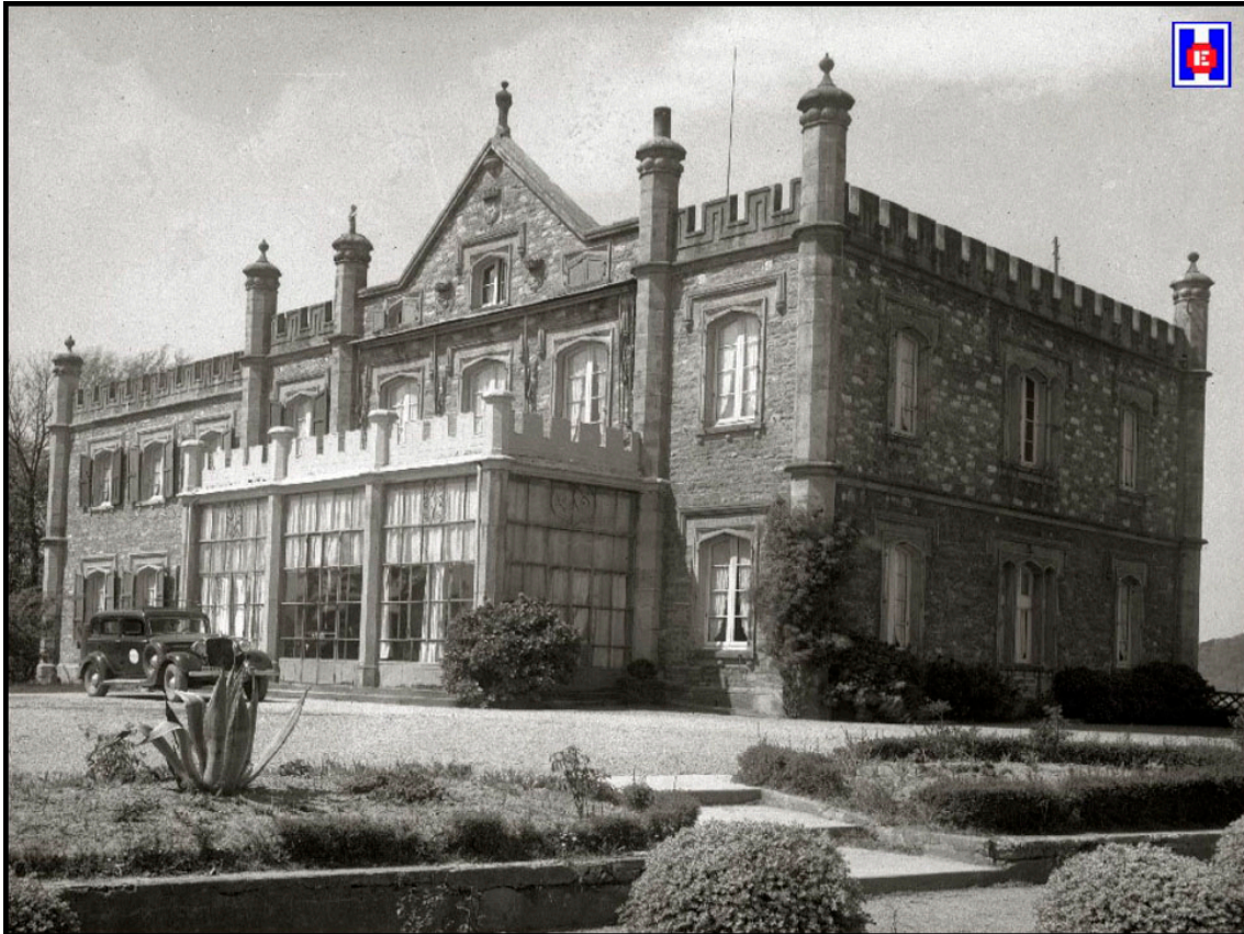
Foto 6 Una vista exterior del edificio convertido en Sanatorio Quirúrgico del doctor Leandro Martín Santos. Foto Guerequiz, 1936