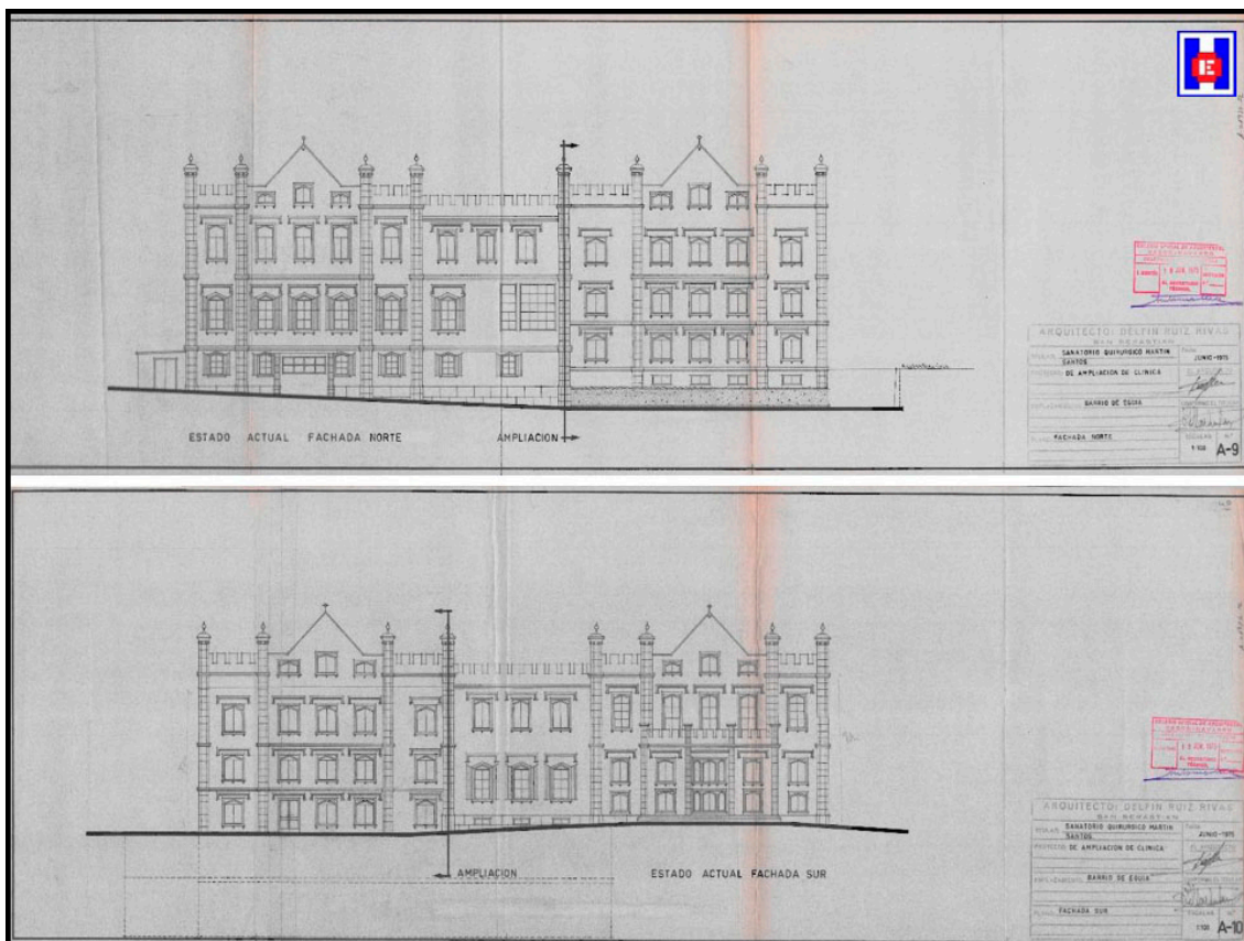
Foto 9 Planos fachada norte y fachada sur. Archivo histórico del Ayuntamiento de Donostia – San Sebastián, 1975