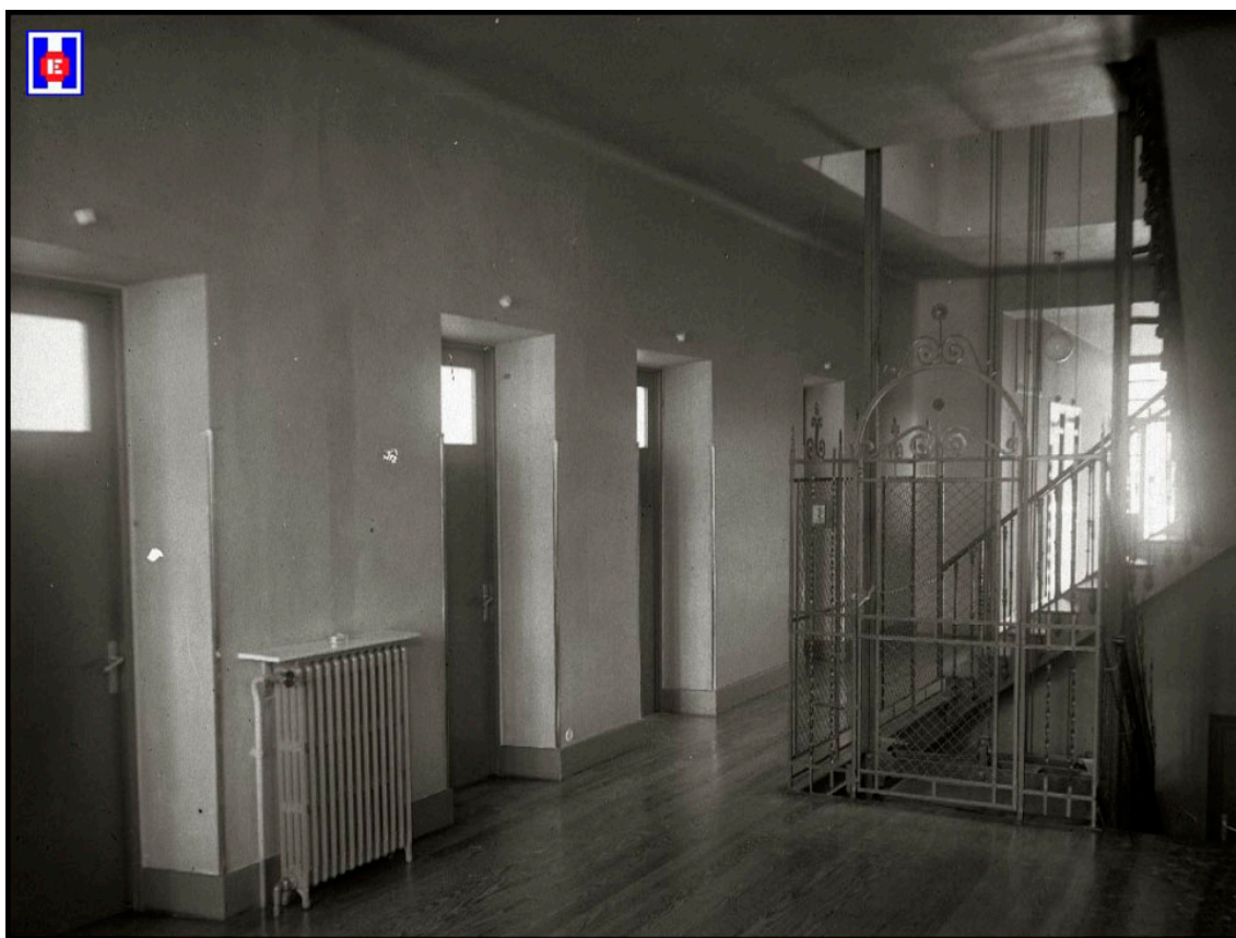
Foto 4 Todas las habitaciones convergen en un vestíbulo general, donde se encuentra el montacargas y las escaleras.

En el piso primero, dedicado, como el segundo, para clínica, además de los servicios de salas de espera y despachos, se han instalado las habitaciones de estancia para enfermos, decoradas, como decimos antes, en colores delicados, suaves, con camas “ad-hoc” del mismo tono que las paredes de la habitación y juego de mobiliario igualmente en consonancia. Estas habitaciones tienen todas, su cuarto de aseo contiguo, para mayor comodidad del enfermo.