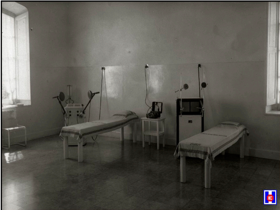
Foto 23 Sala de electricidad para masajes y recuperación de los huesos. Clínica Martín Santos. Foto: Pascual Marín 1945

También fuiste vocal del Colegio durante ocho años, ¿qué destacarías de esta etapa?