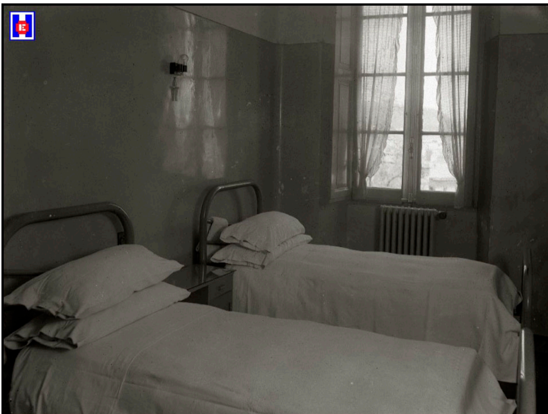
Foto 24 Cuarto de dos camas de la Clínica Martín Santos. 1945

Soy un ferviente admirador de la profesión de Enfermería. Cuenta con una formación y una forma de actuar fantástica. En cuanto a los consejos, no me gusta darlos, les diría que les guste lo que hacen, nada más. Esto es fundamental.