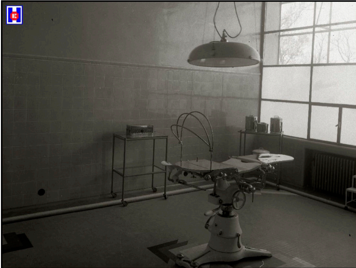
Foto 14 Quirófano Clínica Martín Santos. Foto: Pascual Marín 1945

Aquí, durante muchos años ejerció la medicina y su nombre traspasó los pequeños límites de Guipúzcoa, llegando su fama de experto cirujano a media España y al sur de Francia, de donde venían a consultarle y a someterse a sus consejos. De la medicina hizo su sacerdocio y por eso sus enfermos le adoraban (8).