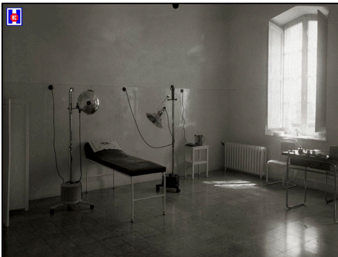
Foto 15 Sala de Curas y de corrientes. Clínica Martín Santos. 1945

Mercedes en la Avenida de Navarra de San Sebastián (9).