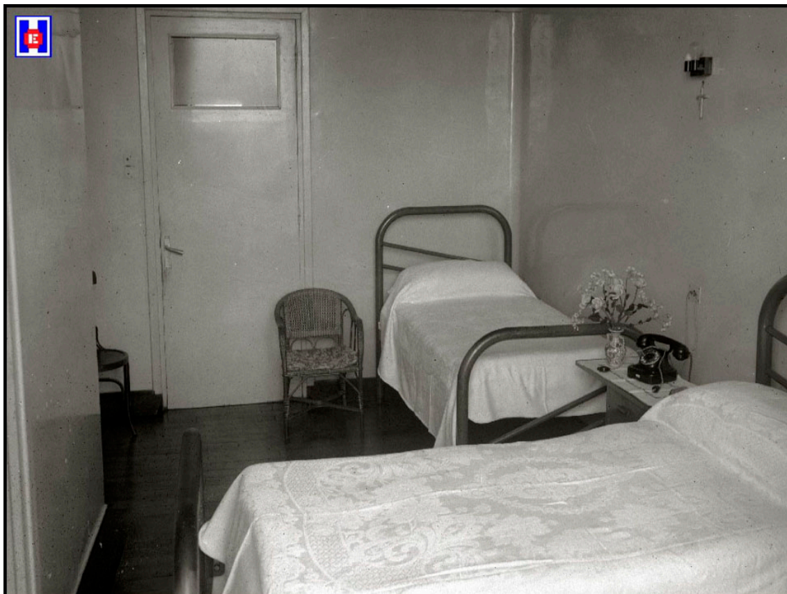
Foto 26 Cuarto de dos camas de la Clínica Martín Santos. Foto: Pascual Marín 1945

10.- Jalgi. Colegio Oficial de Enfermería de Gipuzkoa. Número 69. Invierno 2019 Fotografías de Juantxo Egaña realizadas a Luis Mari Aguirreolea Esteban