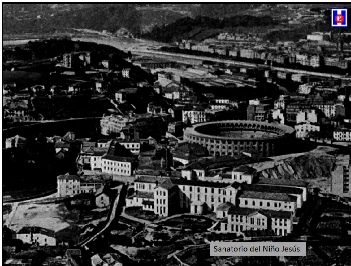
Foto 1 Sanatorio del Niño Jesús, antiguo pabellón Docker del Hospital de San Antonio Abad de San Sebastián