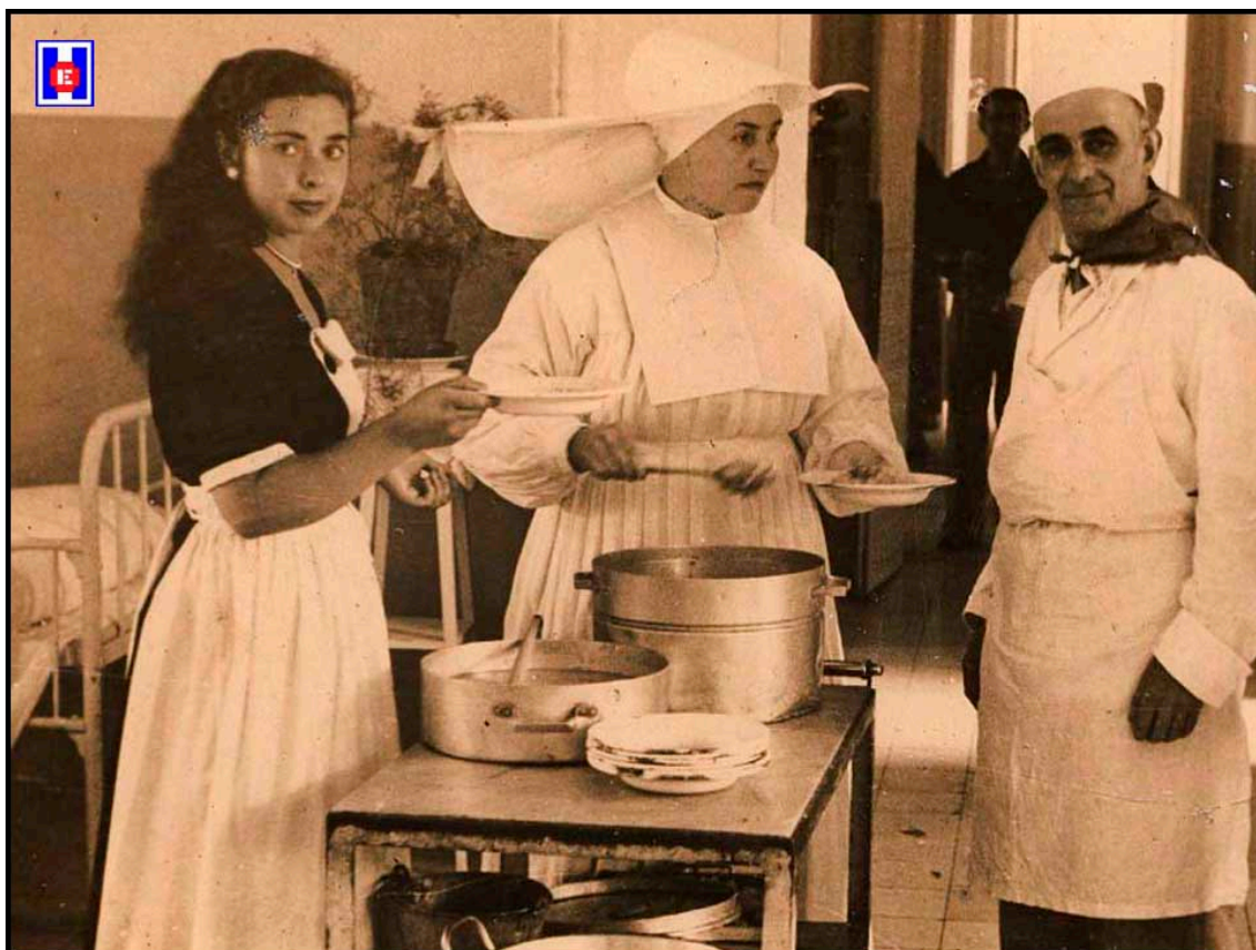
Foto 13 Comida de la Sociedad Kondarrak a los enfermos del Hospital de San Antonio Abad de San Sebastián.

Ayer domingo día 29 de abril, en la Sala de San Damián del Hospital de Santiago Abad, tuvo lugar un emotivo acto con ocasión del ágape dado por la caritativa Sociedad “Kondarrak” del barrio de Gros de esta ciudad (7).