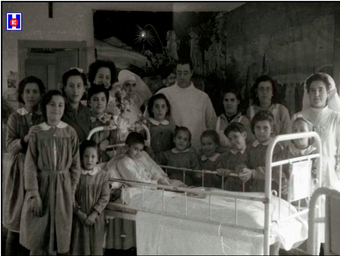
Foto 4 Niños y personal sanitario y no sanitario en el Sanatorio del Niño Jesús, antiguo pabellón Docker del Hospital de San Antonio Abad de San Sebastián

contribuir a la habilitación del nuevo Pabellón Infantil, para lo cual han hecho importantes aportaciones por medio de suscripciones abiertas entre ellas y sus clientas. También tuvo frases de gratitud para “ Radio San Sebastián ”, que a través de su « Hora Infantil » ha contribuido a la benemérita obra, y asimismo dio las gracias a las autoridades por su asistencia al acto inaugural (2).