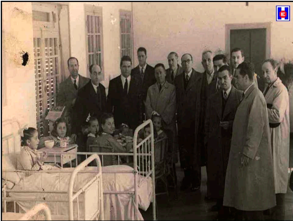
Foto 10 Las directivas de las tres Sociedades Gastronómicas del barrio de Gros: Gimnástica de Ulía, Umore – Ona y Kondarrak con sus presidentes, en el Pabellón Infantil del «Niño Jesús» del Hospital de San Antonio Abad de San Sebastián.