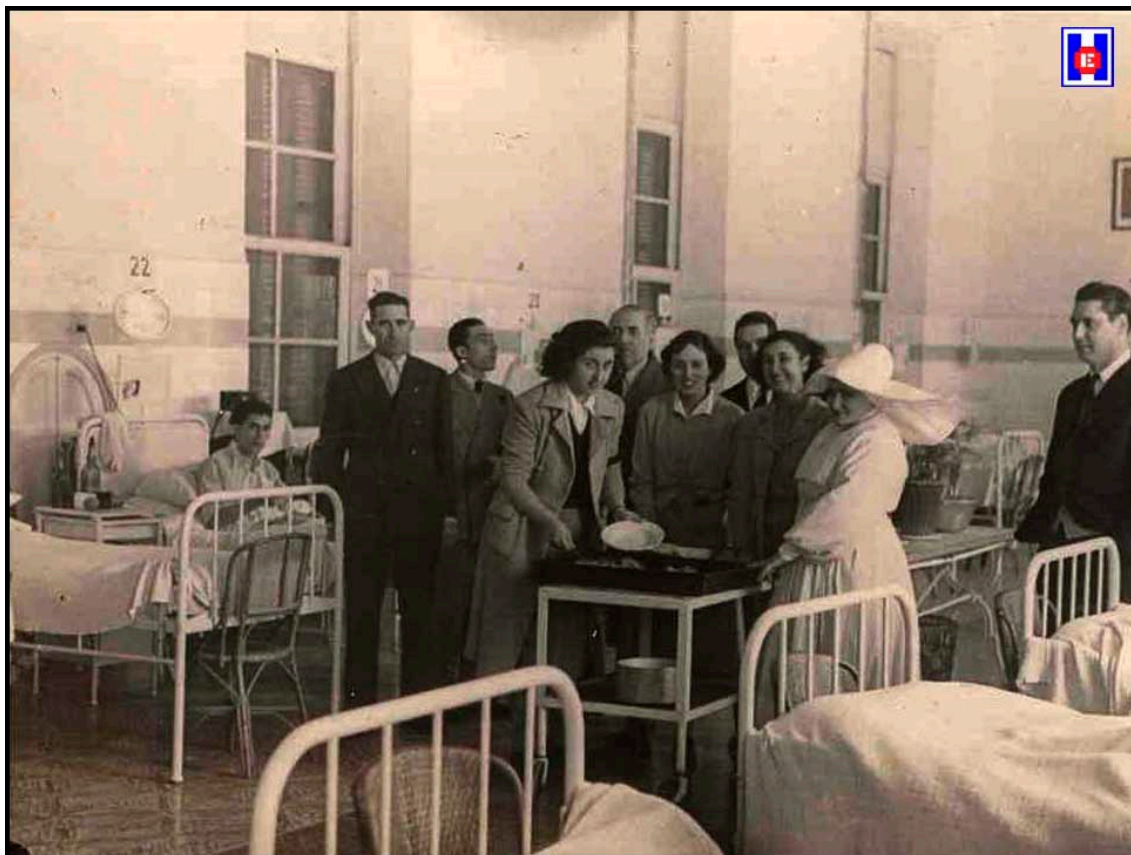
Foto 9 Sirviendo la comida a los enfermos, mujeres de los socios de las Sociedades Gastronómicas: Gimnástica de Ulía, Umore – Ona y Kondarrak con sus presidentes.

representaciones de las Sociedades Umore Ona, Kondarrak y otras del barrio de Gros, pelotaris, corredores y demás elementos deportistas.