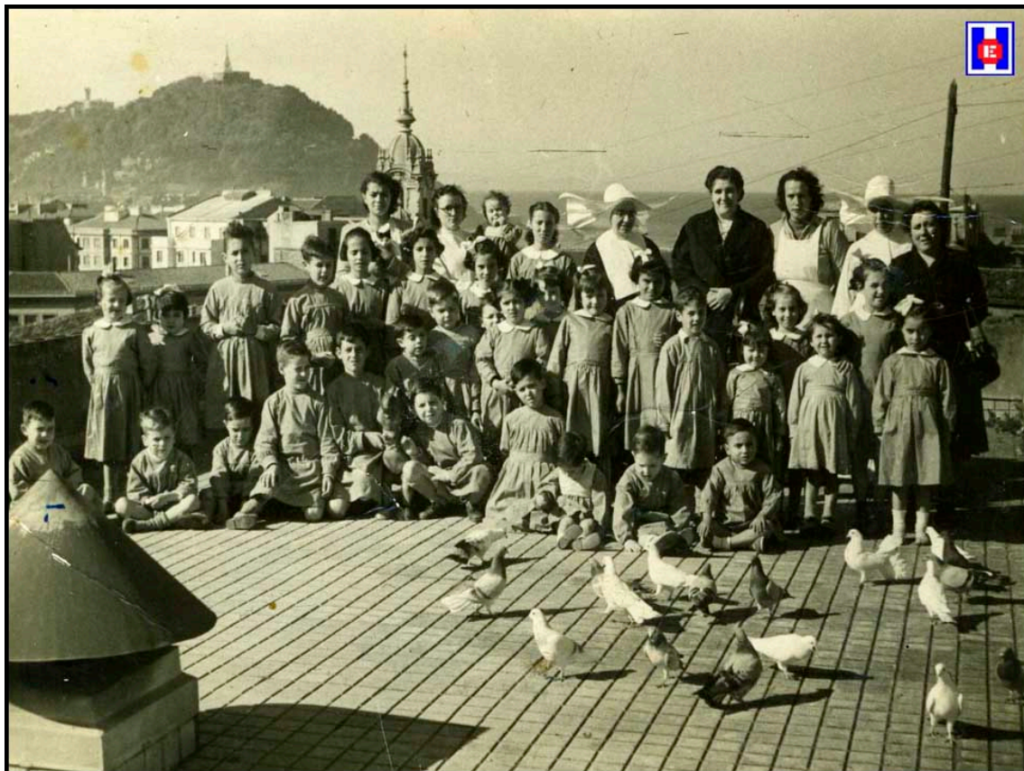
Foto 8 Hijas de la Caridad con los niños en la terraza del Pabellón Infantil del «Niño Jesús» del Hospital de San Antonio Abad.

A continuación fue descubierta la lápida y se hizo una visita al Pabellón Infantil, siendo luego las autoridades obsequiadas con una copa de vino español.