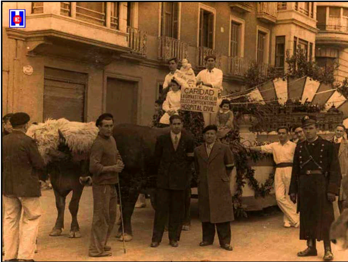
Foto 17 Carroza de la Sociedad Gimnástica de Ulía, recaudando fondos para los enfermos del Hospital Civil San Antonio Abad de San Sebastián.

música el reposo obligatorio de los enfermos que estaban ingresados en el Hospital de San Antonio Abad de San Sebastián.