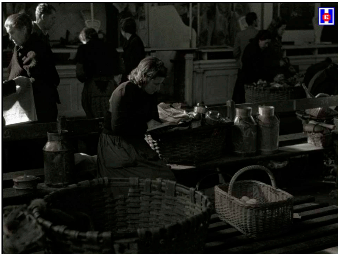
Foto 5 Mujer baseritarra vendiendo sus productos en el Mercado. Gracias a estas mujeres trabajadoras, entusiastas y bienhechoras del Mercado de la Brecha que tanto se han desvelado y con tanto acierto y provecho, en favor del nuevo Sanatorio Infantil

Las autoridades y personalidades concurrentes al acto fueron obsequiadas con un vino español. El acto fue amenizado por los chistularis de la Congregación de Luises del barrio del Antiguo (2).