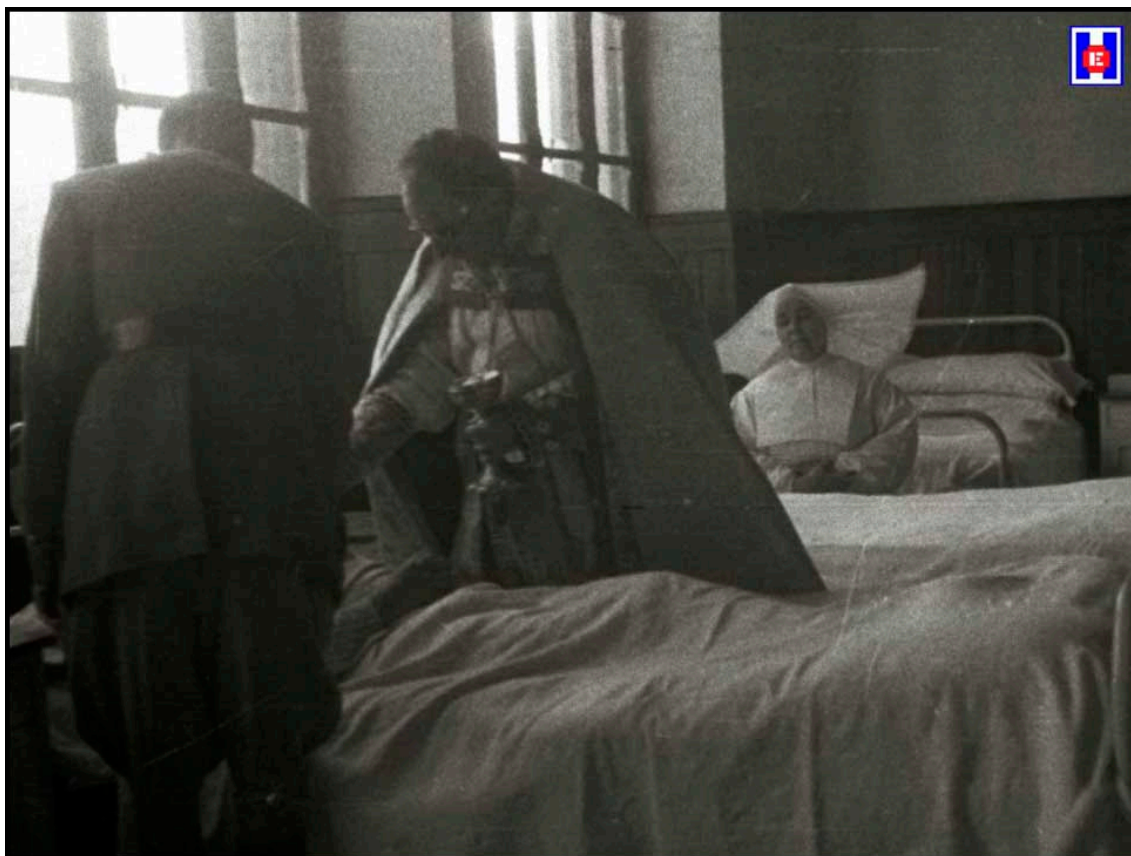
Foto 12 Enfermo recibiendo la “Comunión Pascual” en el Hospital de San Antonio Abad.

Con toda solemnidad se celebró ayer, a las ocho y media de la mañana, en el Hospital de San Antonio Abad, la “ Comunión Pascual ” de los enfermos acogidos en el citado benéfico establecimiento (6).