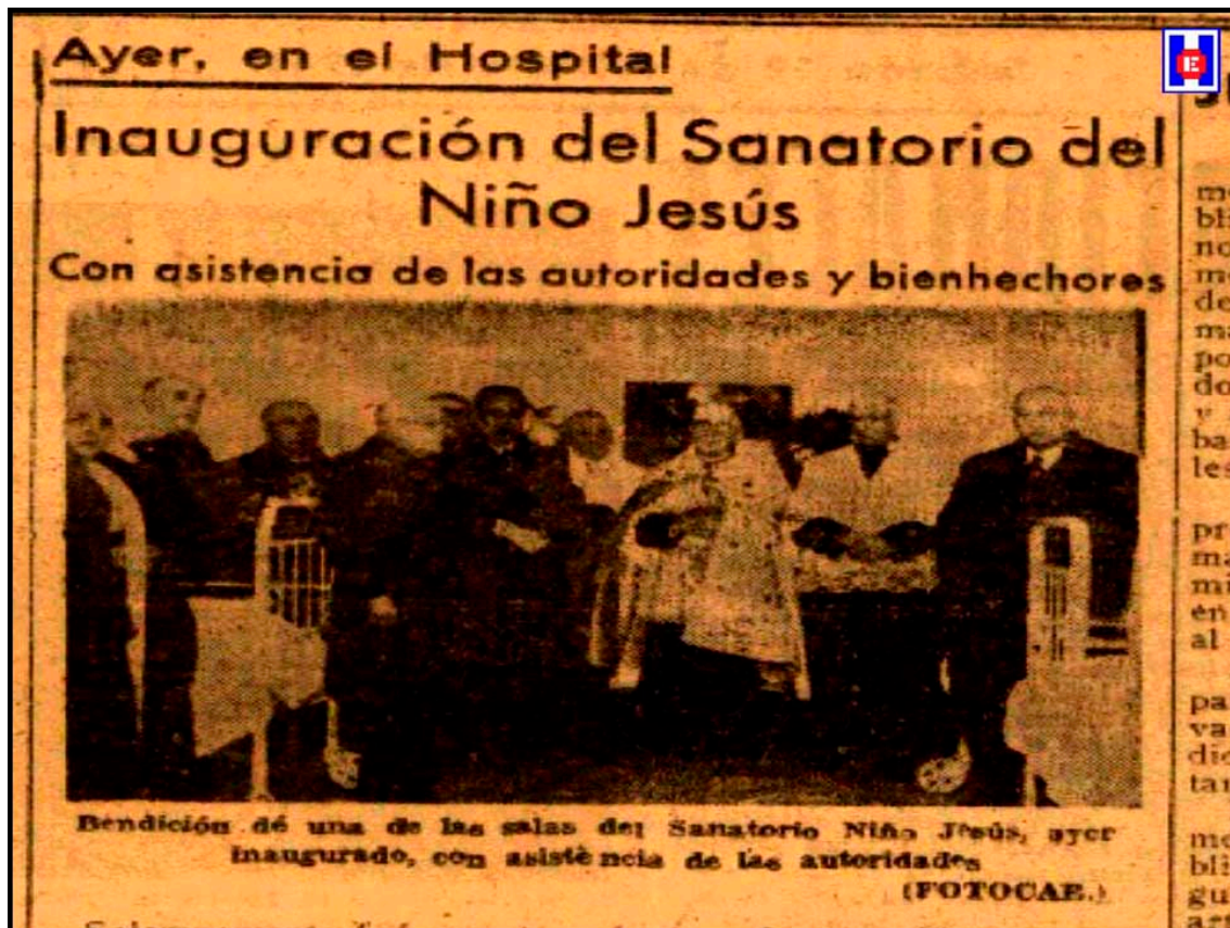
Foto 3 Bendición de una de las Salas del Sanatorio del Niño Jesús, ayer inaugurado, con asistencia de las autoridades.

La lectura de esta carta, fue acogida con grandes aplausos, lo mismo que todos los que intervinieron en este simpático y emotivo acto, fiesta de legítima satisfacción y alegría para el Hospital de San Antonio Abad (1).