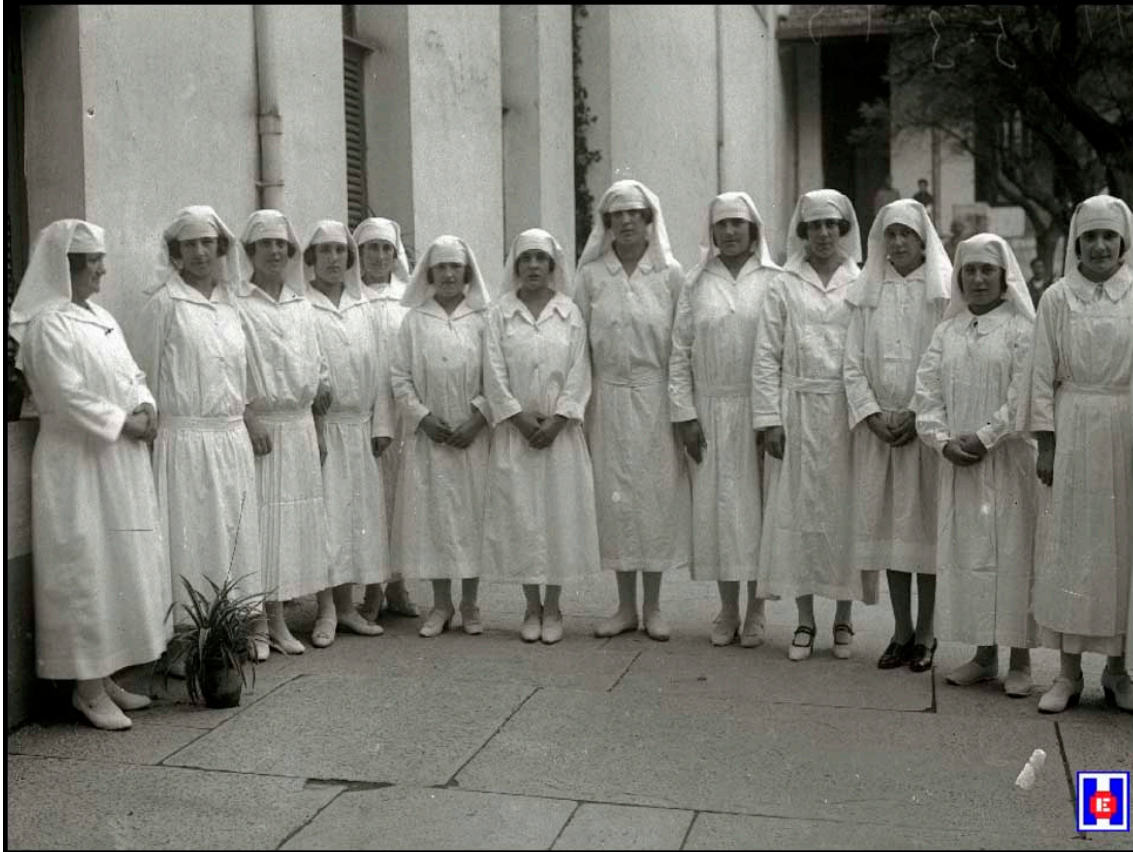
Foto 14 Grupo de enfermeras donostiaras en el patio interior del Hospital San Antonio Abad de San Sebastián. Noviembre de 1924