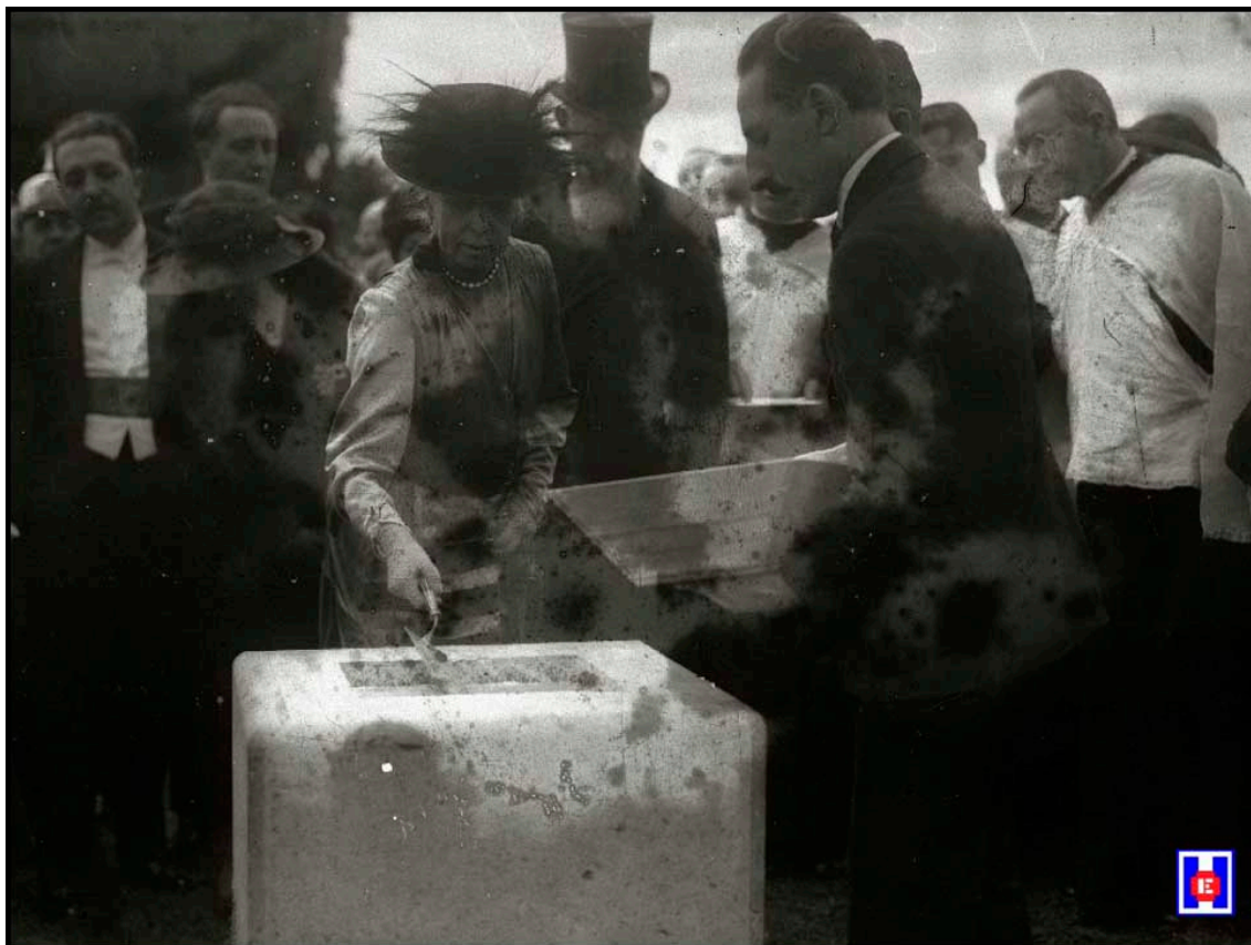
Foto 10 S. M. la Reina doña María Cristina , echó unas paletadas de tierra sobre la piedra, depositando en una cajita de zinc varios periódicos y monedas

Sociedades donostiarra de carácter oficial o popular y una representación del Colegio médico de Guipúzcoa.