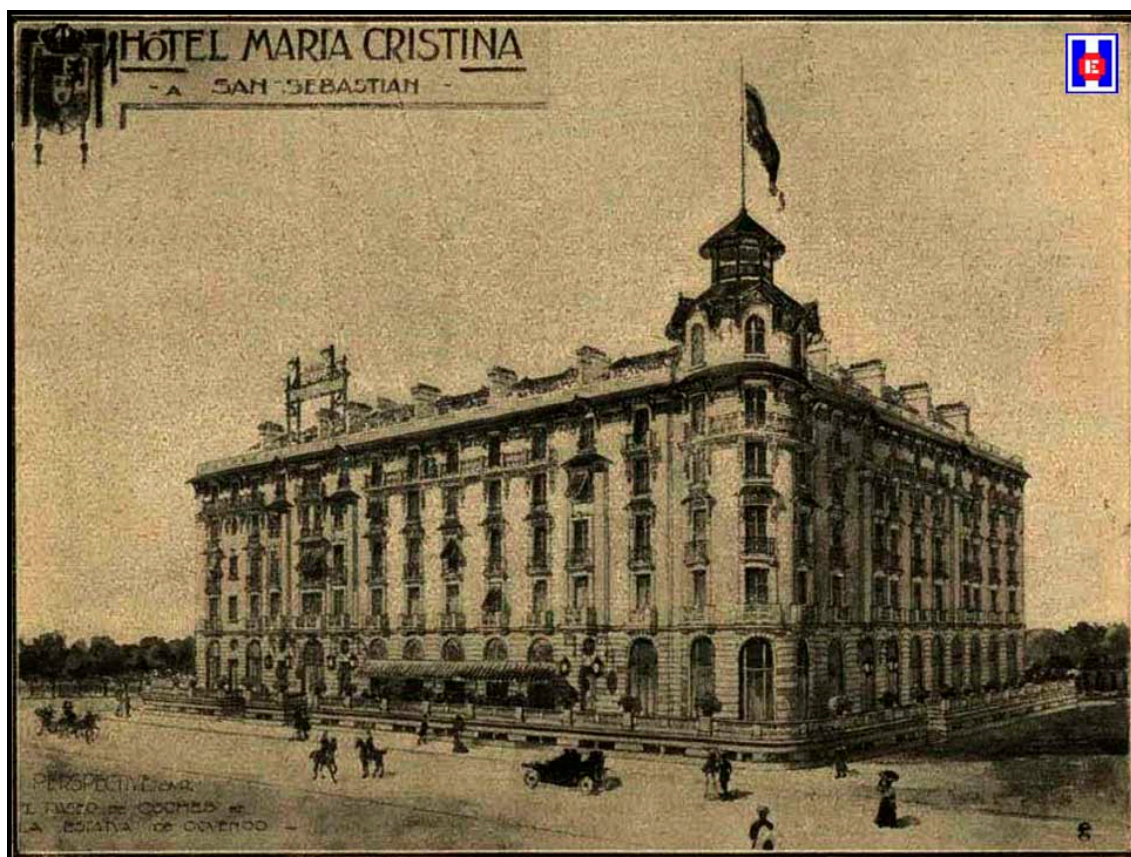
Foto 4 Hotel María Cristina. Así se llamará el Hotel que construye la Sociedad «Fomento de San Sebastián». La presente fotografía desde la perspectiva desde el Paseo de Coches. El Hotel se levantará con arreglo a los planos presentados por el arquitecto del universalmente conocido hotelero Ritz. Será un Hotel que rivalizará en elegancia y «confort» con cuantos ha edificado aquel industrial en las más populosas ciudades de Europa. Revista Novedades, página 21 del 4 de julio de 1909