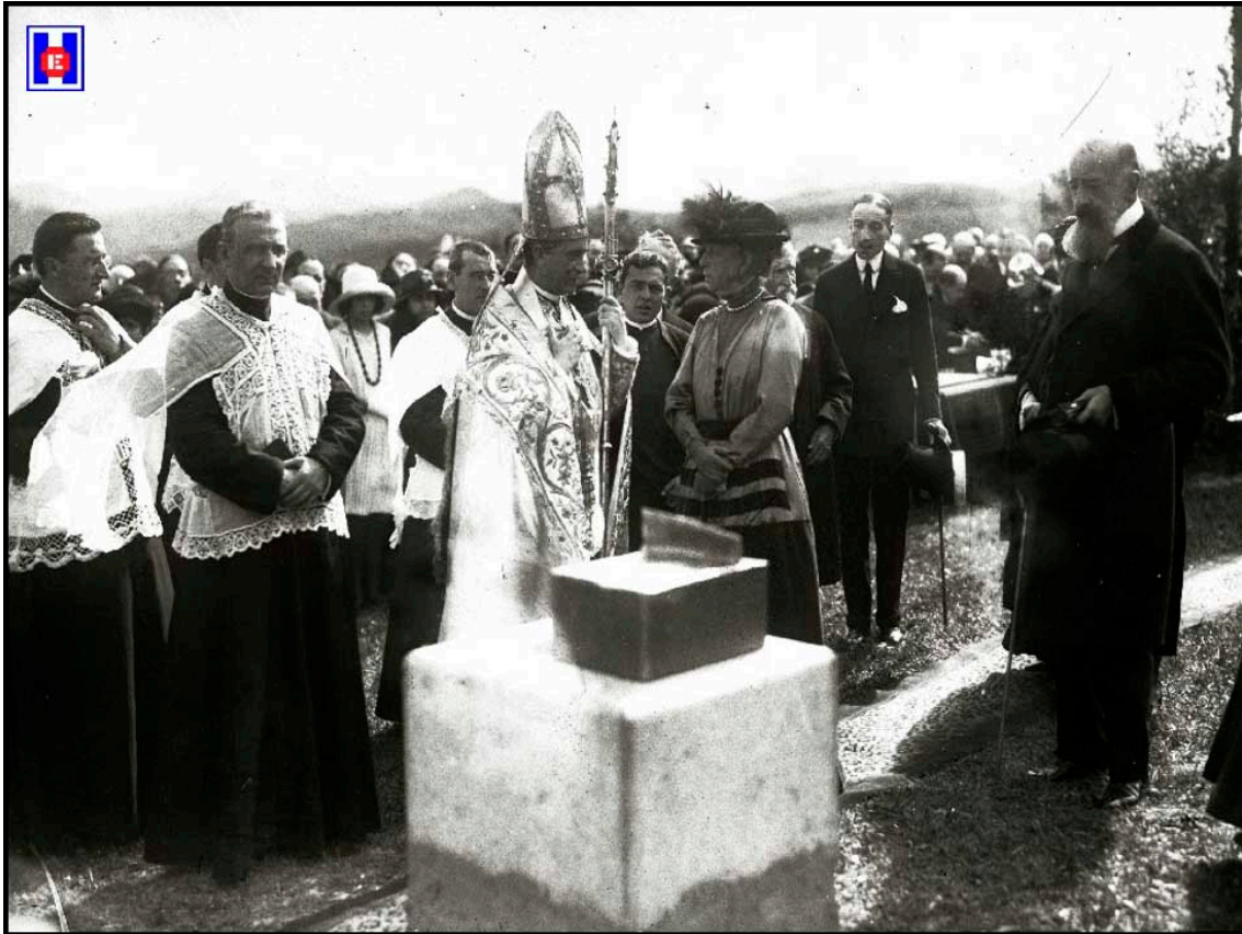
Foto 5 Acto de la Bendición de la Primera Piedra del Hospital Goyeneche