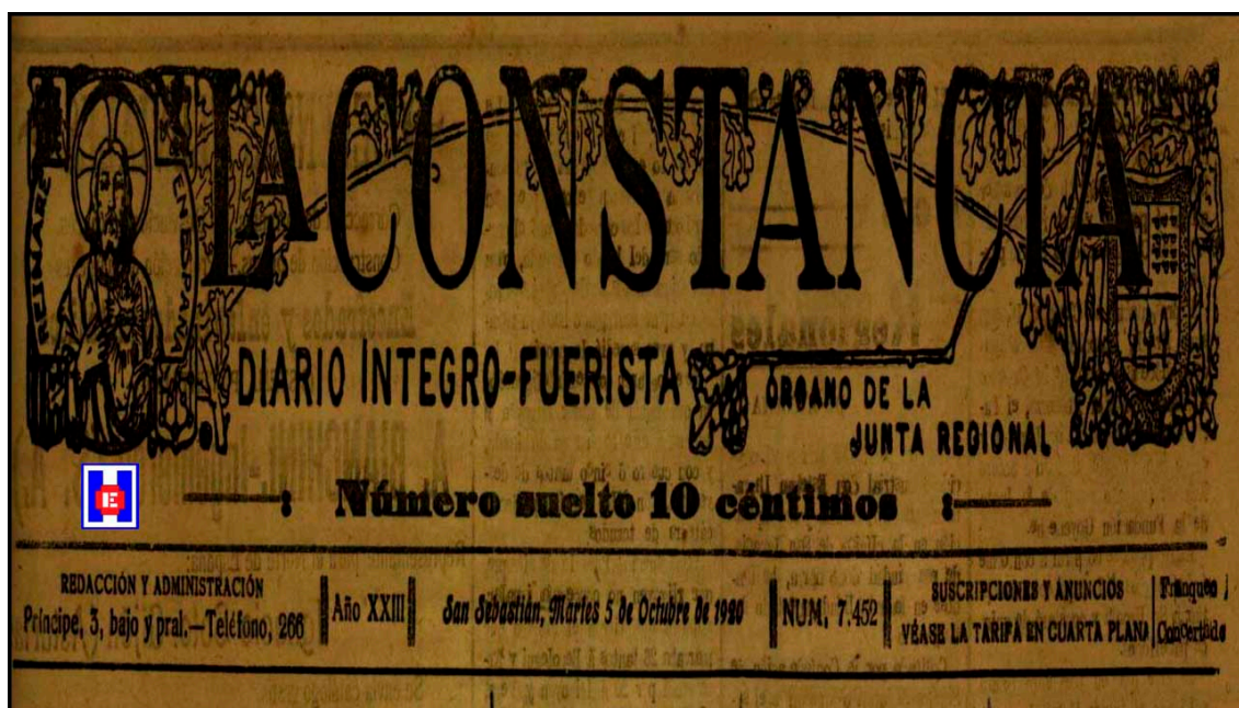
Foto 9 La Constancia. Diario Íntegro-Fuerista, órgano de la Junta Regional. Año XXIII. Número 7.452. Página 1 del martes día 5 de octubre de 1920

Y con esto terminó la solemne fiesta del domingo, de indudable trascendencia para nuestra población (2).