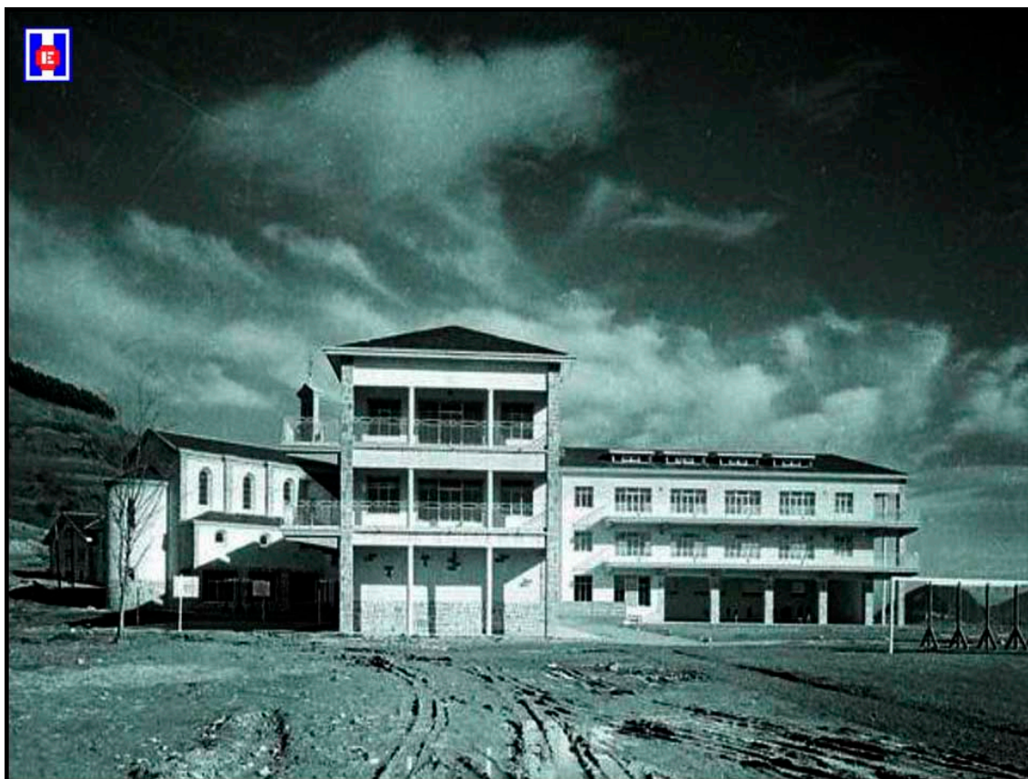
Foto 1 Antigua panorámica de Goyeneche. Diario Vasco del domingo 16 de diciembre de 2018