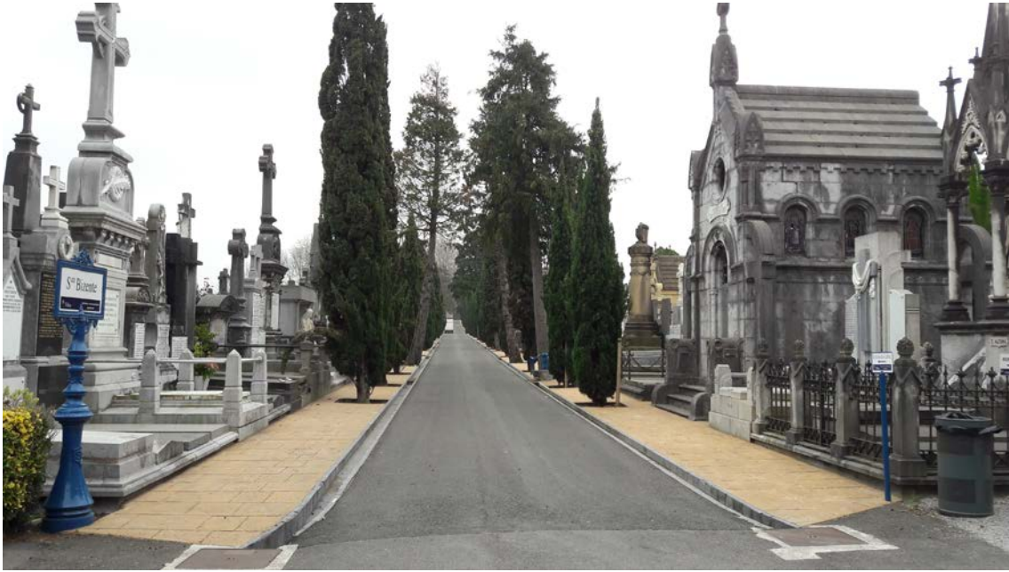
Hilerri zaharreko kale nagusietako baten egungo egoera.