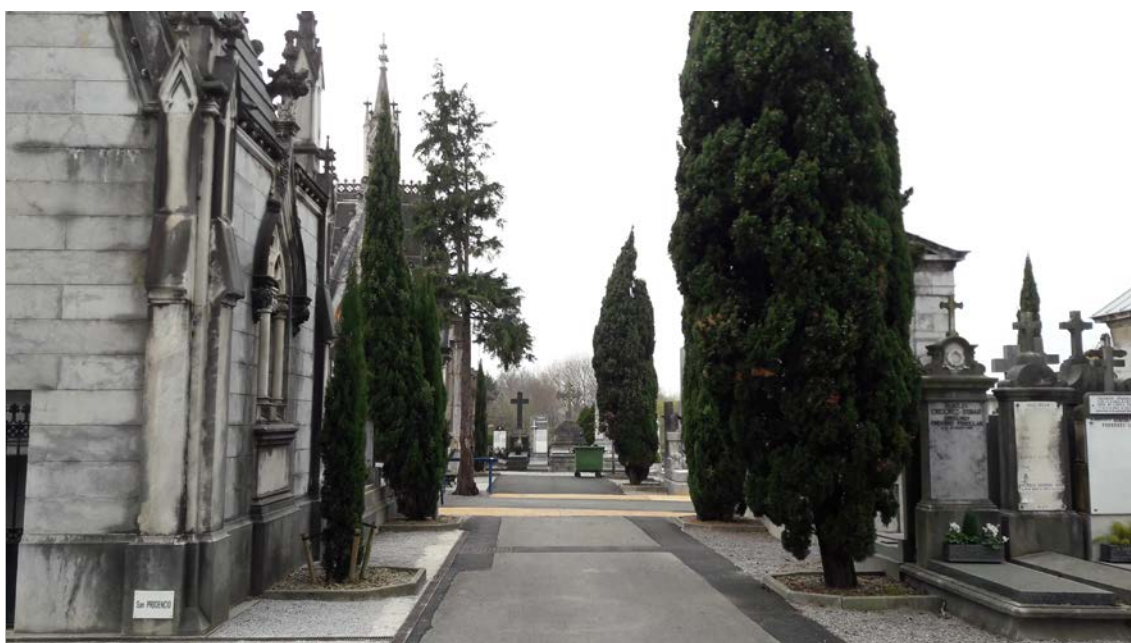
Hilerri zaharreko bigarren mailako kaleetako baten irudia.