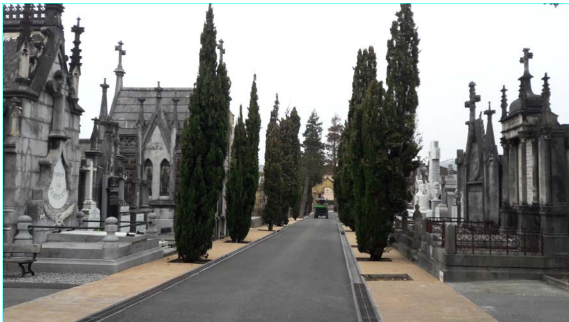
Hilerri zaharreko bide nagusietako baten irudia.