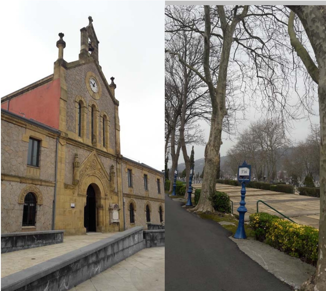
Sarrerako eraikin nagusiaren irudia.

Ondoren azalduko ditugu, ikusmen-paseo gisa aurreko paragrafoetan deskribatutako nolakotasunak eta alderdiak zehazten dituzten hilerriaren irudiak.