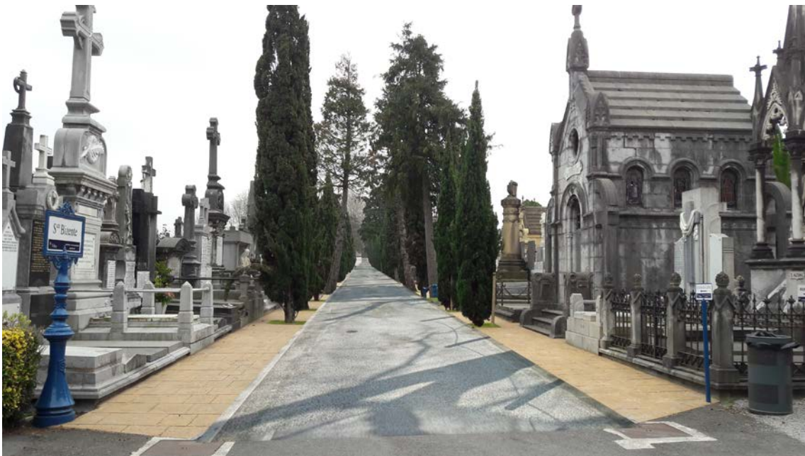
Hilerri zaharreko kale nagusietako baterako etorkizuneko proiektu gisa proposatutako sekzio-mota.