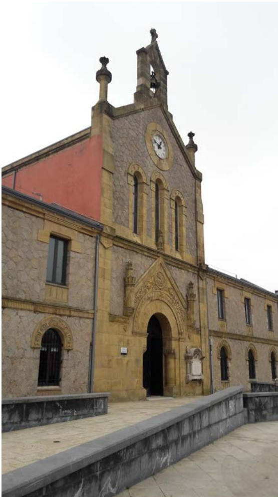
Imagen del edificio principal de acceso.

A continuación se muestran unas imágenes del Cementerio que definen a modo de paseo visual las cualidades y aspectos descritos en los anteriores párrafos.