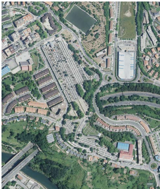
Ortofoto del ámbito del cementerio de Polloe

Estas sucesivas ampliaciones han hecho que el propio cementerio se distinga por tener 5 zonas diferenciadas, comenzando desde la parte norte y finalizando en la zona más al sur del mismo.