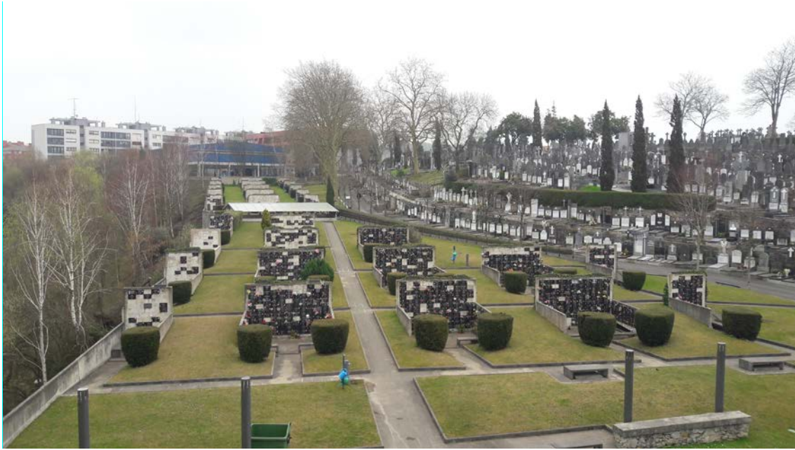
Imagen de la parte nueva del cementerio con el proyecto de los nichos en primer plano