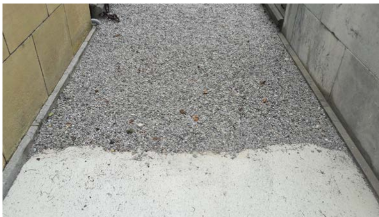
Cambio de tratamiento propuesto para el pavimento de las calles secundarias de la parte antigua.

A su vez, esta solución permite implementar un sistema de recogida de aguas eficaz que impida el deterioro de las sepulturas y las capillas colindantes situando una rejilla lineal fina en el perímetro de las edificaciones.