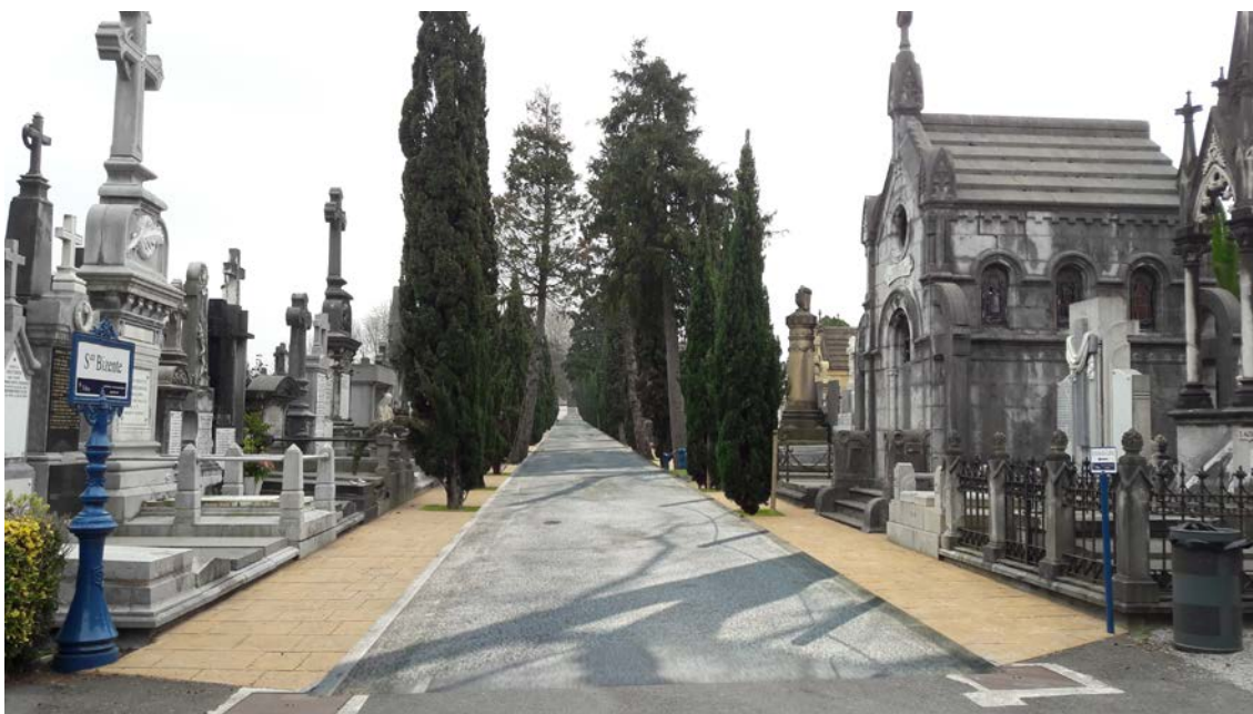
Sección tipo propuesta como proyecto futuro para una de las calles principales del cementerio antiguo.