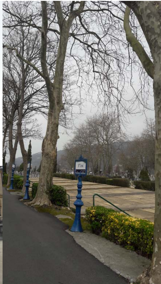
Imagen de los enterramientos en fosas.