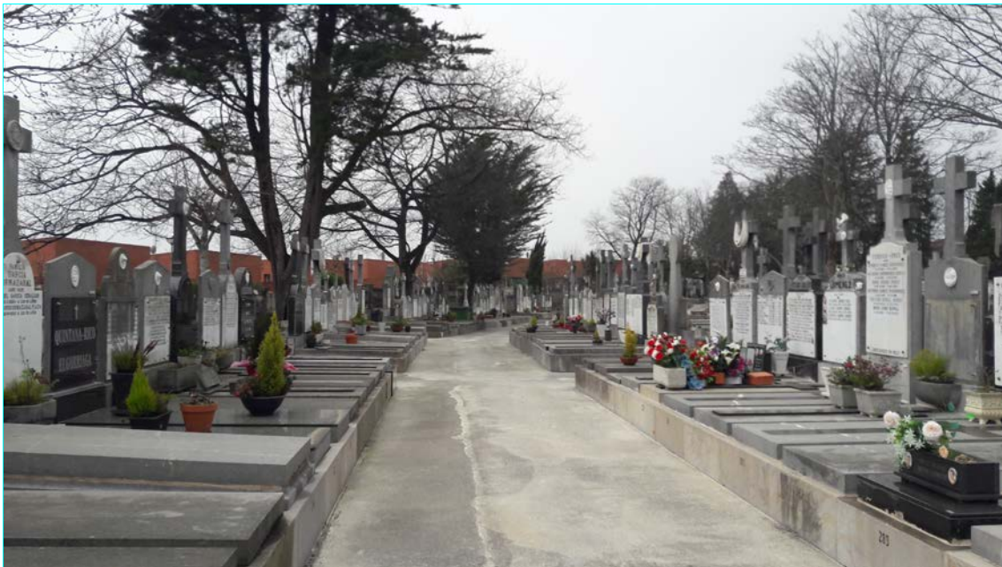
Imagen de una de las calles de la parte nueva del cementerio

Por otra parte, la situación actual de las infraestructuras de servicios se recoge en los planos de ordenación correspondientes a estas (planos II.4.1, II.4.2, II.4.3, II.4.4, II.4.5 y II.4.6 del documento "5. Planos") de este Plan Especial.