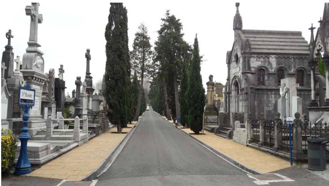
Situación actual de una de las calles principales del cementerio antiguo.