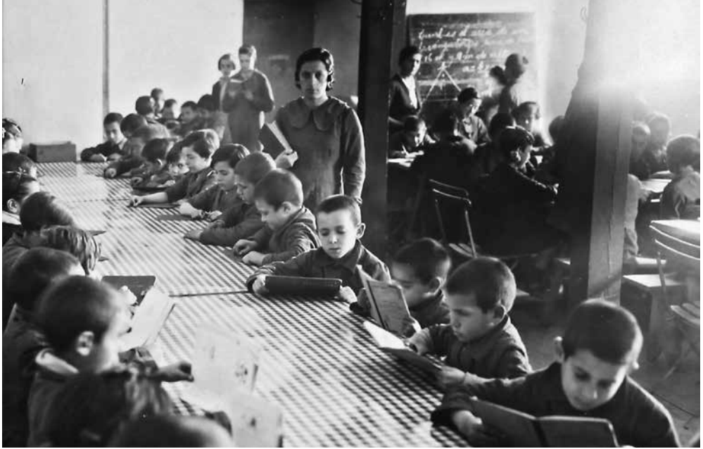
Euskadiko Arxibo Historikoa. Gizarte Laguntza Salaren Funtsa. Archivo Histórico de Euskadi. Fondo del Departamento de Asistencia Social

Klaseak Orthezeko haurren aterpean haur euskaldun errefuxiatuei, 1938. urtea. Clases en el albergue infantil en Orthez a niños vascos refugiados, 1938.