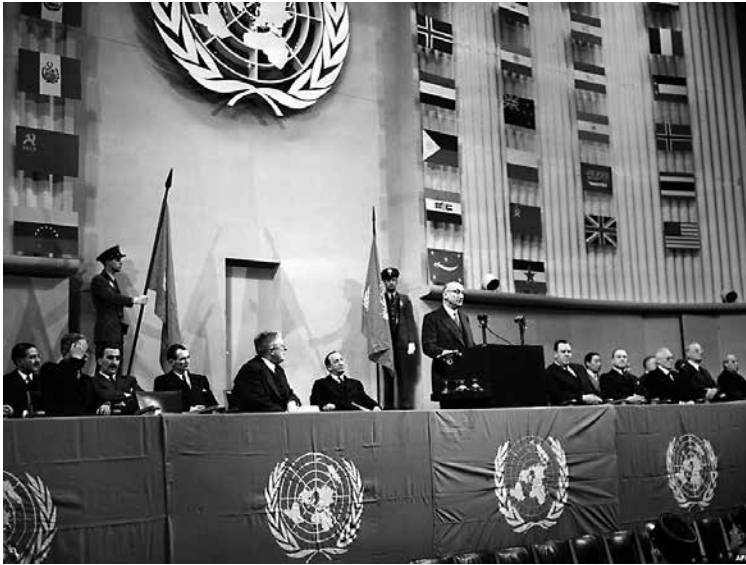
Nazio Batuen Erakundearen argazki-juntas. Fondo fotográfico de Naciones Unidas.

1948an, Nazio Batuek hezkuntza funtsezko askatasuntzat jo zuten Giza Eskubideen Adierazpen Unibertsalean.