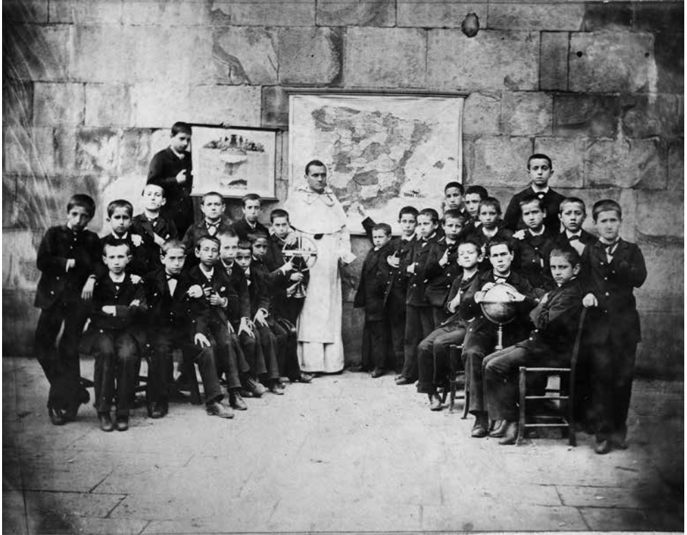
Kubateka. Munoa Funtza. Fondo Munoa.