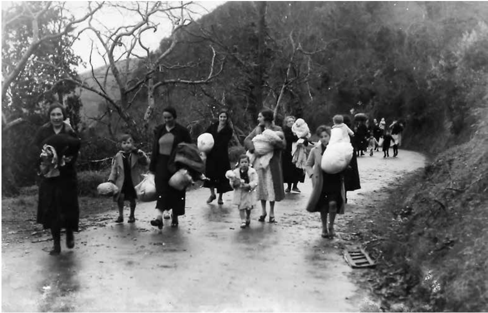
Euskadiko Artxibo Historikoa. Lehendakaritza Sailaren Funttsa. Archivo Histórico de Euskadi. Fondo del Departamento de Presidencia

Gipuzkoako biztanleria zibila Bizkaira ihes egiten, armada frankista aurrera egiten ari zela ikusita. Huida de la población civil guipuzcoana hacia Bizkaia ante el avance del Ejército franquista.