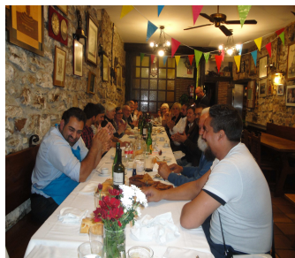
Gastronomía Romani Soc.Kañojetan/ Kamelamos