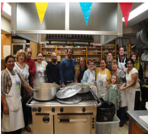
Gastr. Nicaraguense Casa.Galicia/ Mujeres del Mundo Unidas