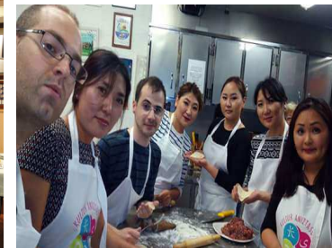
Gastronomía de Mongolia Sociedad Amaiak Bat/ Grupo Mongolia