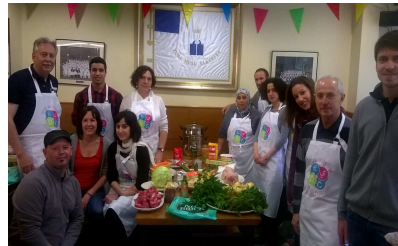
Gastronomía marroquí Soc. Zubi Musu/ Asoc.iación Jatorkin