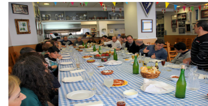
Gastronomía mexicana Loiolatarra Deport./Asoc.Mestiza