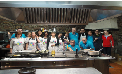
Gastronomía rusa: Baso Etxea / Asoc Rusa Nasledie

Consiste en Talleres de Cocina impartidos en sociedades gastronómicas de Donostia por personas de otras culturas y a los que pueden asistir socios y socias de la sociedad gastronómica, vecinos y vecinas del barrio y personas relacionadas con las asociaciones participantes. Después de cada taller tiene lugar una comida en la propia sociedad a la que pueden asistir todas las personas participantes y ciudadanía en general. Este año se han celebrado 9 talleres diferentes