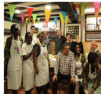
Gastronomía guineana Esperanza CD./AS. Afrika-euskadi