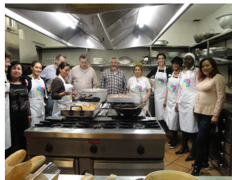
Gastronomía ecuatoriana Centro Buralés / As. Esperanza Latina