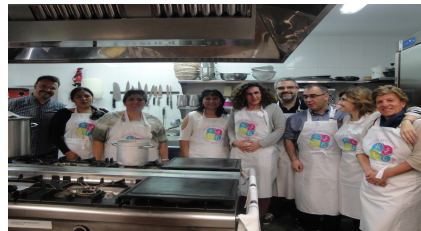
Gastronomía boliviana Txirain /Asoc Mi Nuevo Potosí